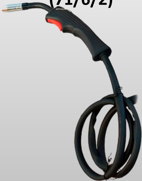
Горелка для САИПА-165 (71/6/2)