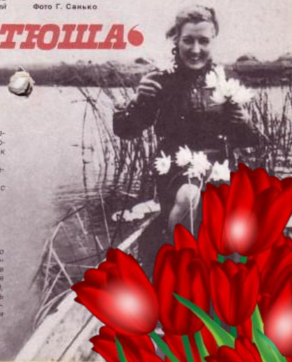
М. Блантер и М. Исаковский.