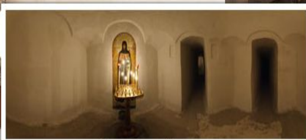
Икона Божьей матери