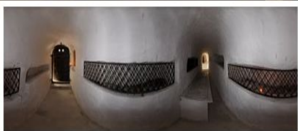
Усыпальницы с мощами