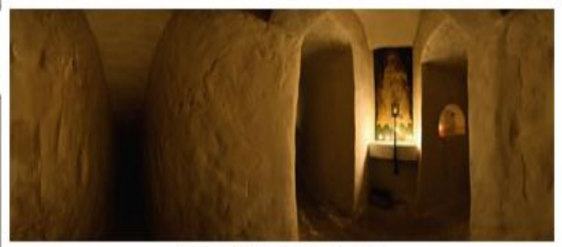
Икона божьей матери