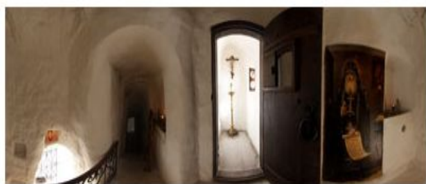
Келья Иоанна Затворника