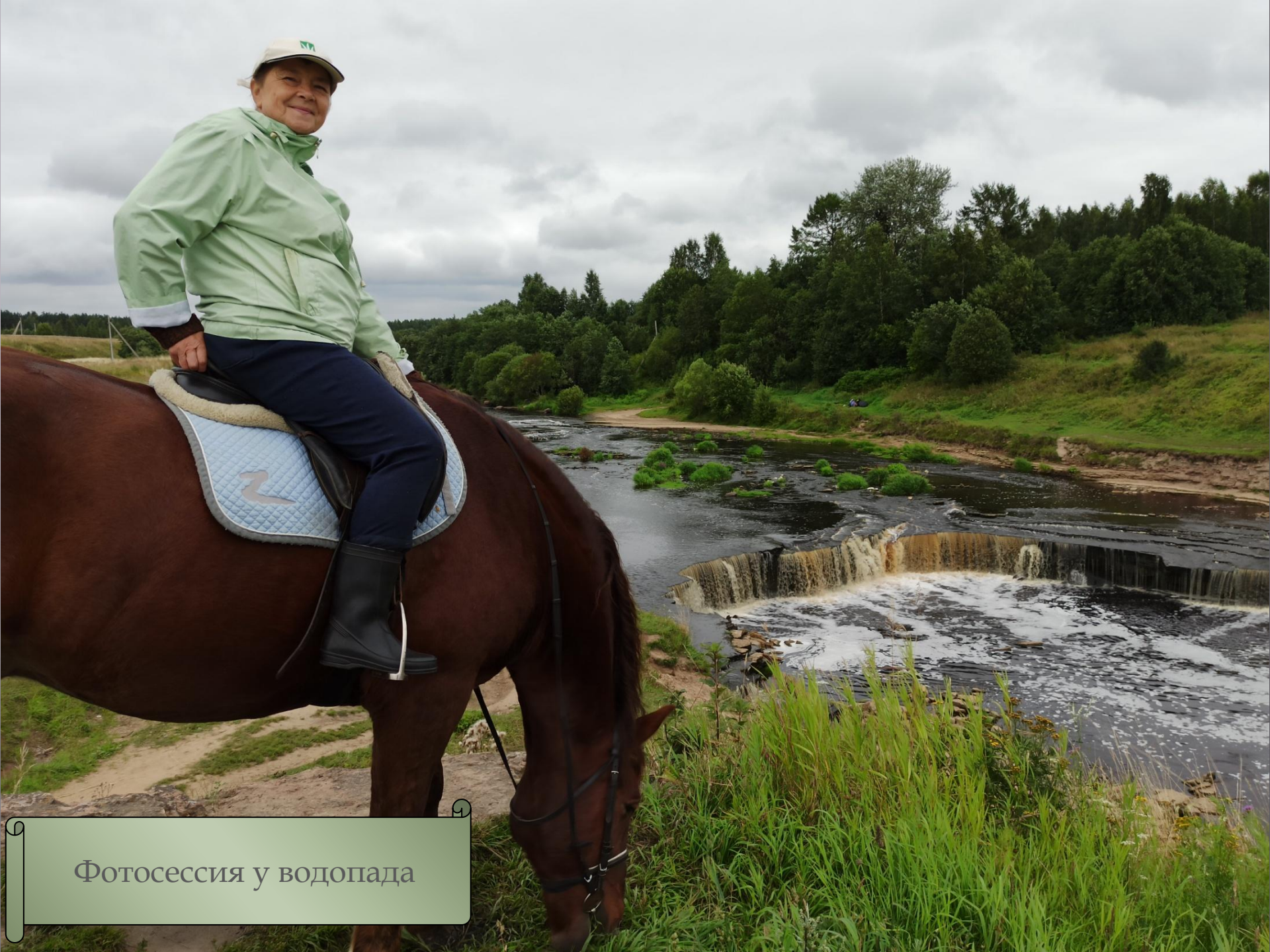
Фотосессия у водопада