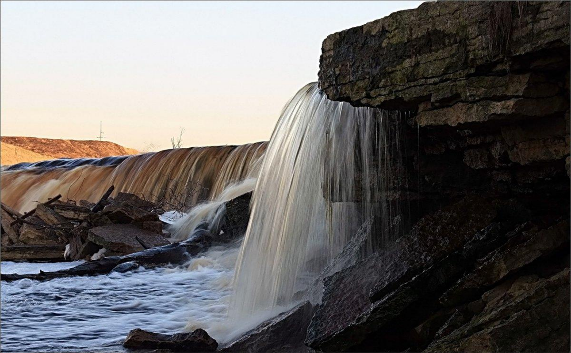
И вот Тосненский водопад