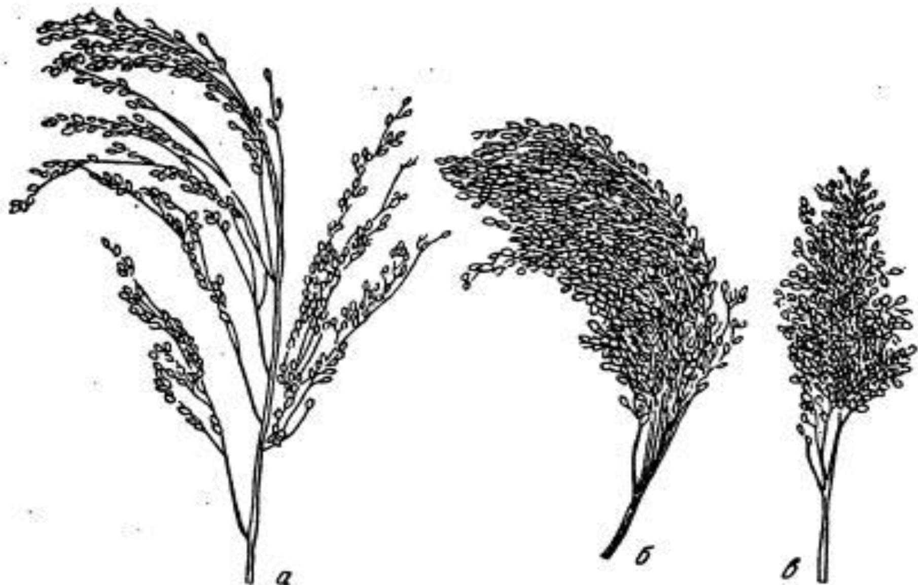
Рис. 33. Формы метелок проса: а — развесистого; б — пониклого; в — комового.