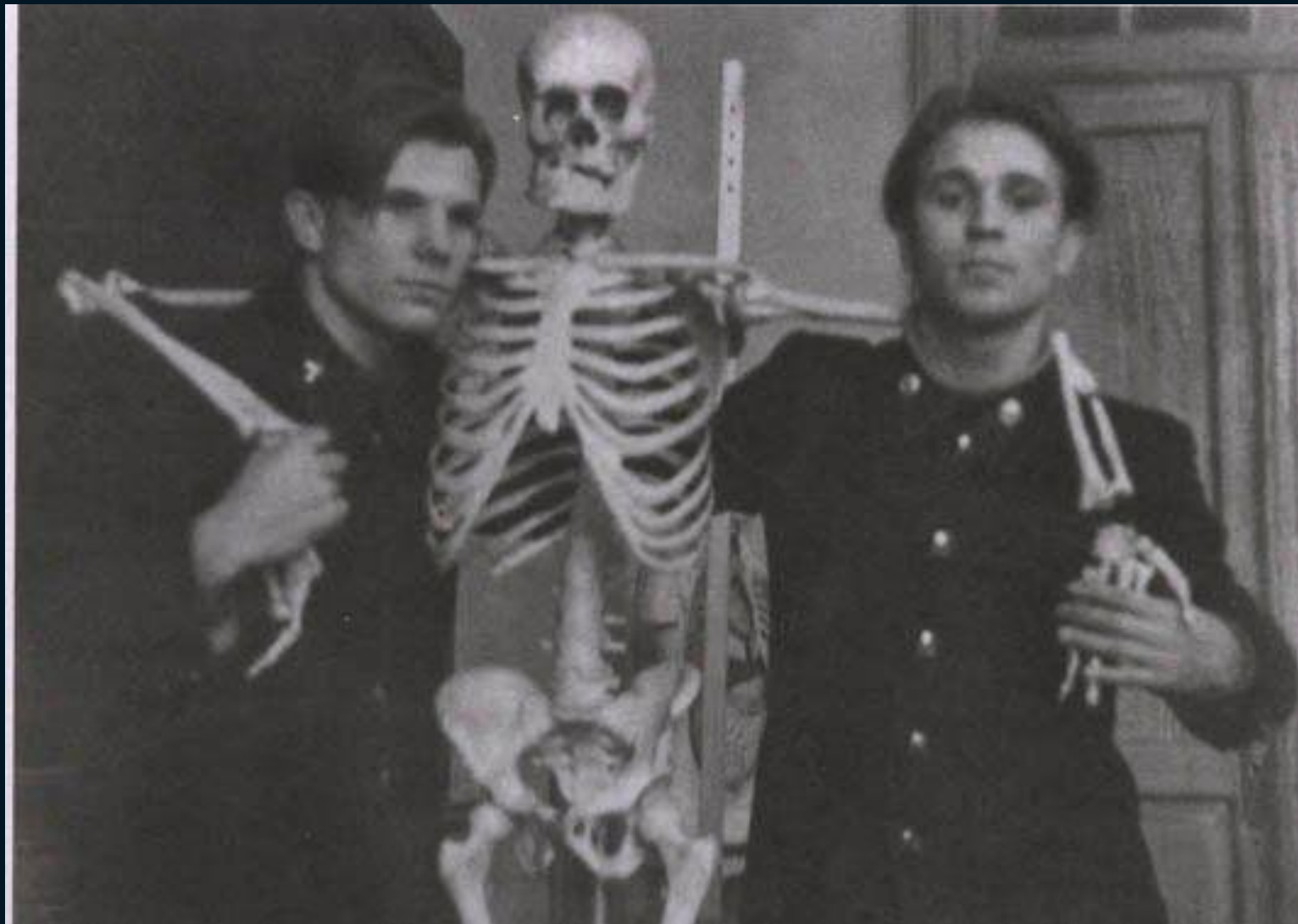
Гагарин в кабинете анатомии.