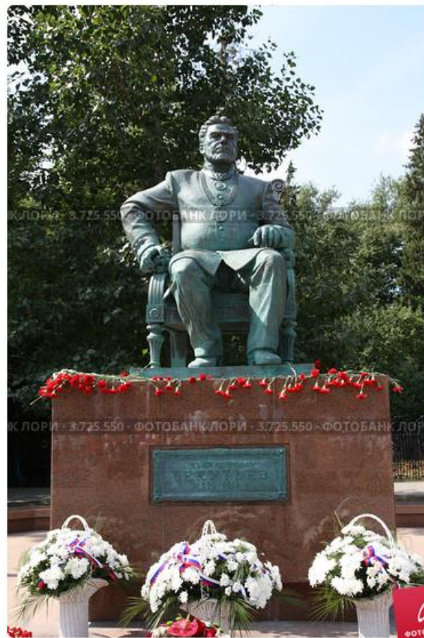
Памятник Текучеву А.И., г. Тюмень