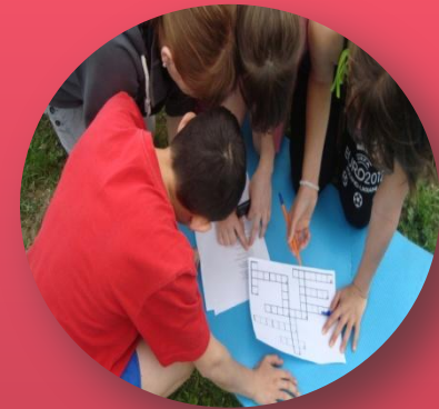
Игровой(игра по станциям)