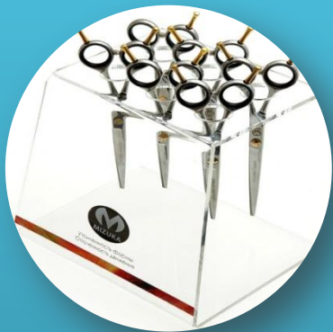
Творческий(подставка под ножницы)