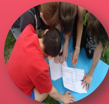
Игровой(игра по станциям)