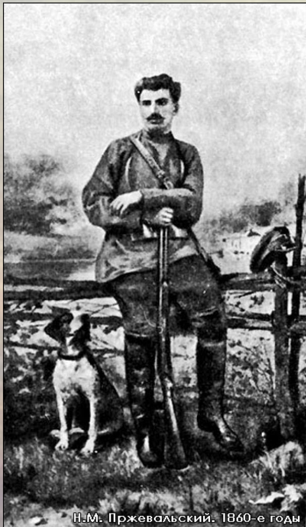
Н.М. Пржевальский. 1860-е годы