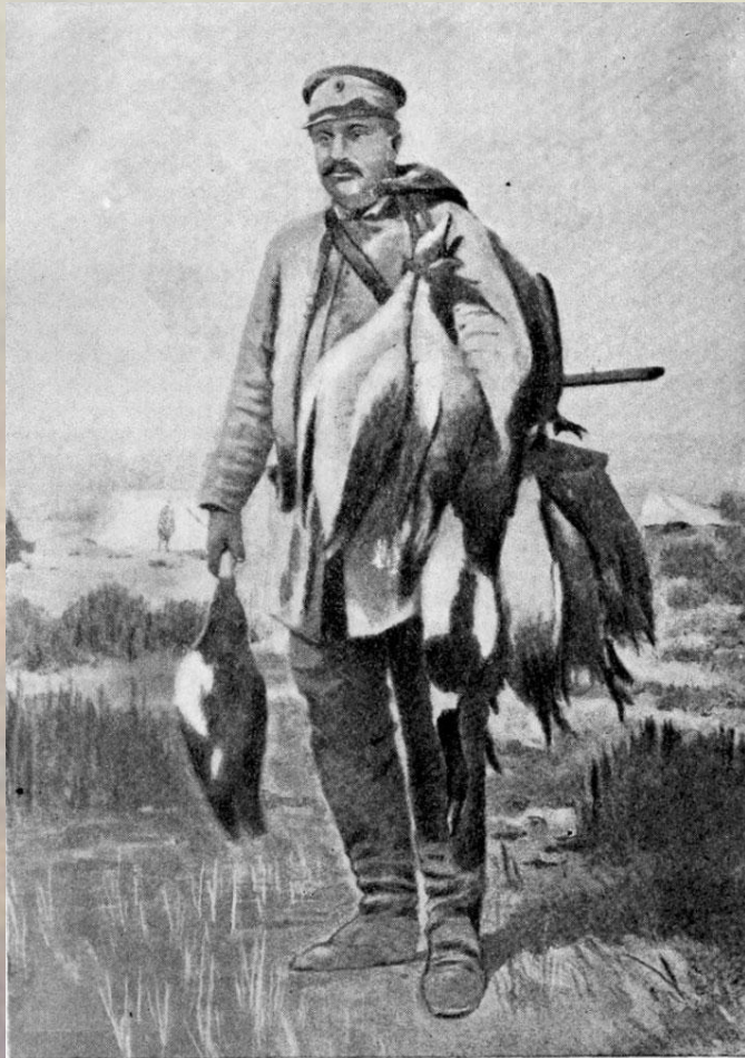
Н. М. Пржевальский в 1876 г. После охоты на Лоб-норе.