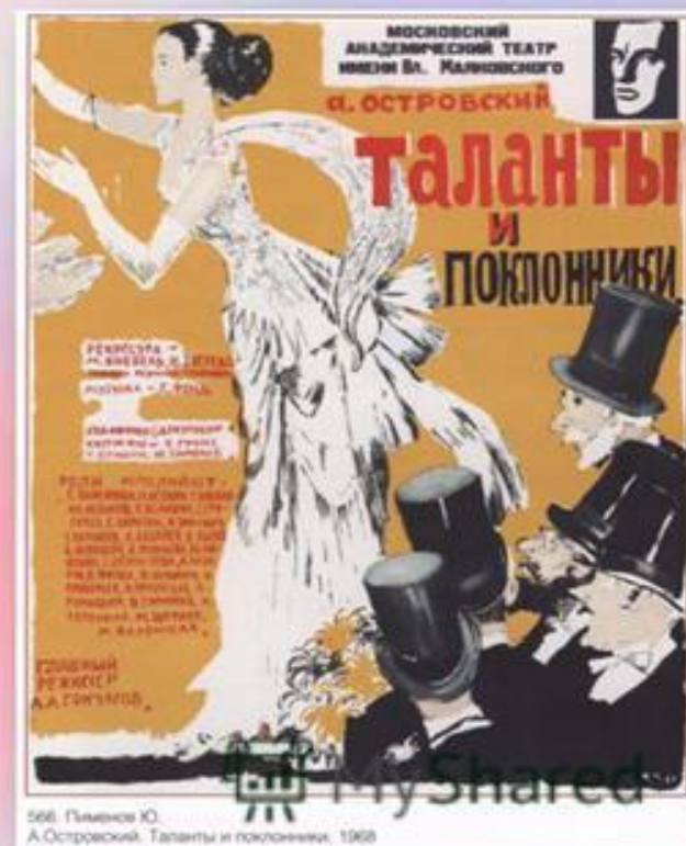
566. Паминко Ю. А.Островский. Таланты и поклонники, 1928