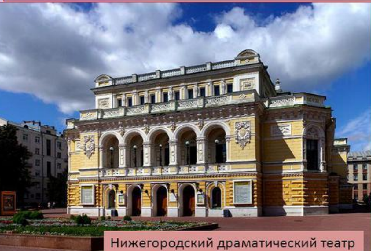
Нижегородский драматический театр

К драматической литературе относятся драма, комедия, трагедия, трагикомедия, мистерия, водевиль, фарс, мелодрама.