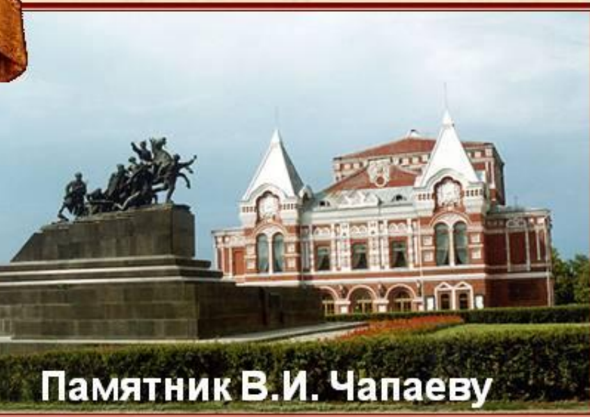
Памятник В.И. Чапаеву