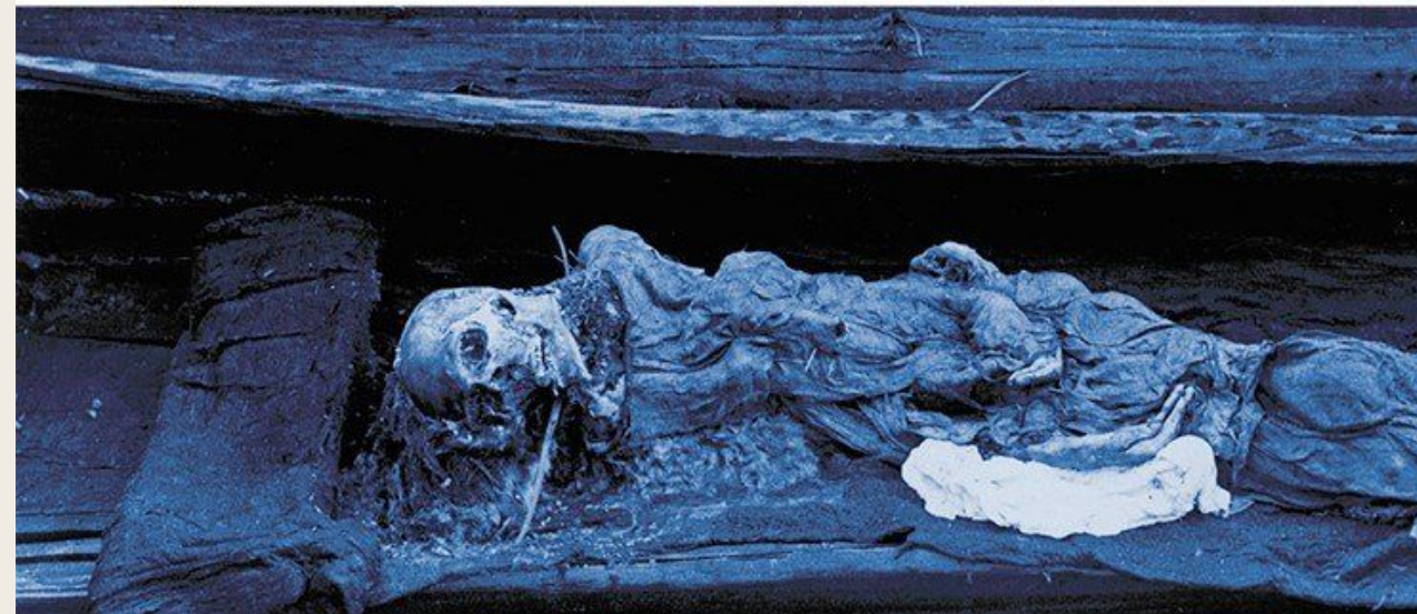
Погребальная камера с колодой, в которой лежала мумия женщины.