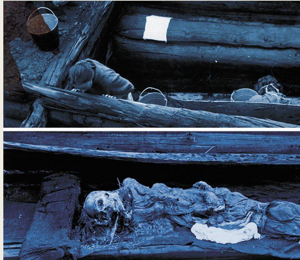
Погребальная камера с колодой, в которой лежала мумия женщины.