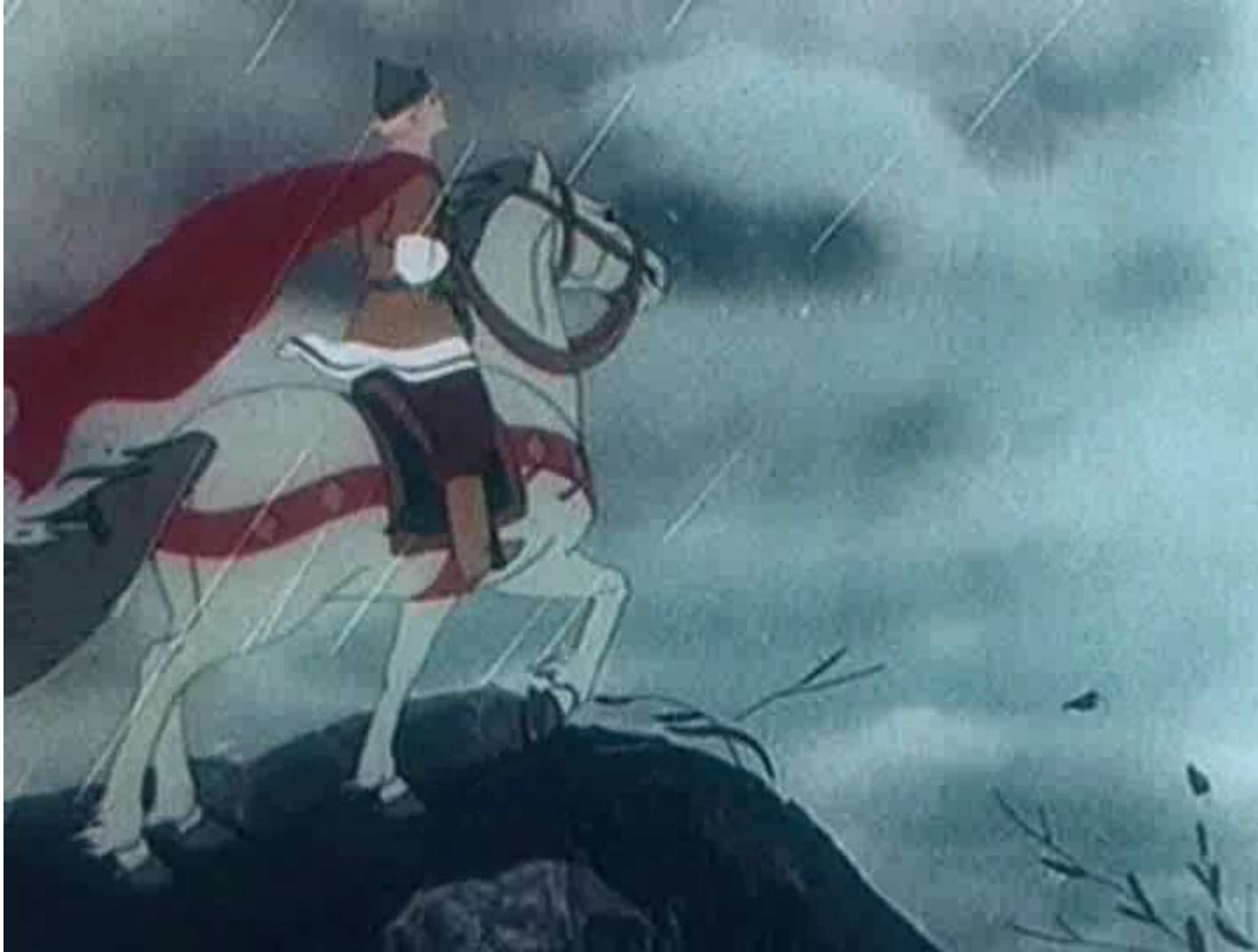
Королевич Елисей- жених царевны