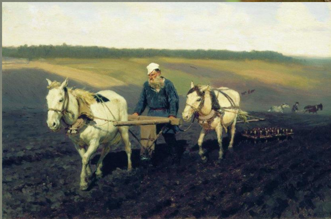
И. Репин. Пахарь. Л. Н. Толстой на пашне