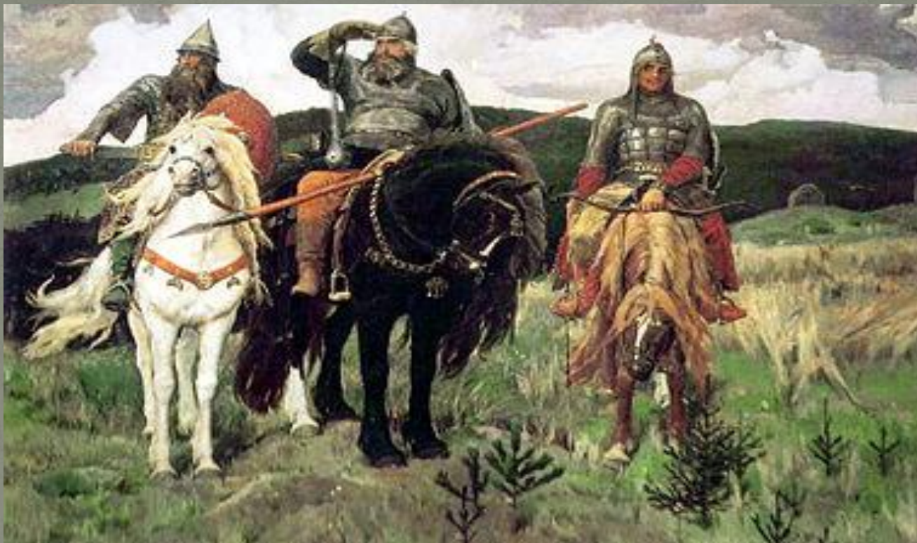
В. М. Васнецов "Богатыри"

В мирные дни русский человек был крестьянином, пахарем, сеятелем, кормильцем. А в дни лихолетья становился воином, защитником. Образ защитника земли русской воспет в былинах, это образ русских богатырей. Былины повествуют о мужественной борьбе русских людей против врагов – кочевников.