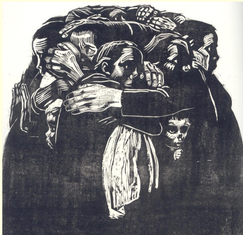
Матери, гравюра из цикла «Война», 1922-1923 гг.

Снова и снова в графике и скульптурах Кете Кольвиц поражают не только необычное выражение лиц и позы персонажей, но, прежде всего, руки. То поддерживающие, то защищающие, иногда сжатые в кулак, и при этом просящие; то сплетённые в жесте солидарности или братском объятии, они почти всегда несколько непропорционально велики и всё увереннее заполняют пространство картин.