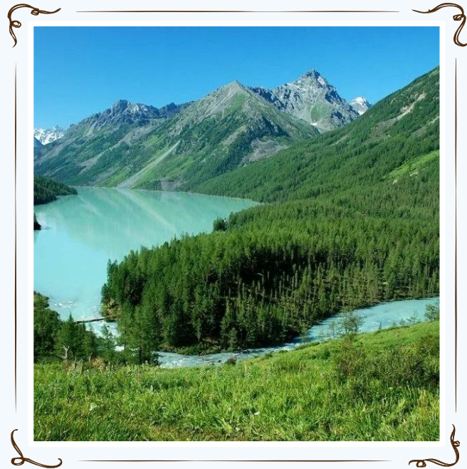
Золотые горы Алтая