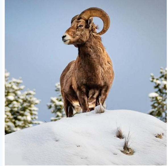
Горный баран аргали