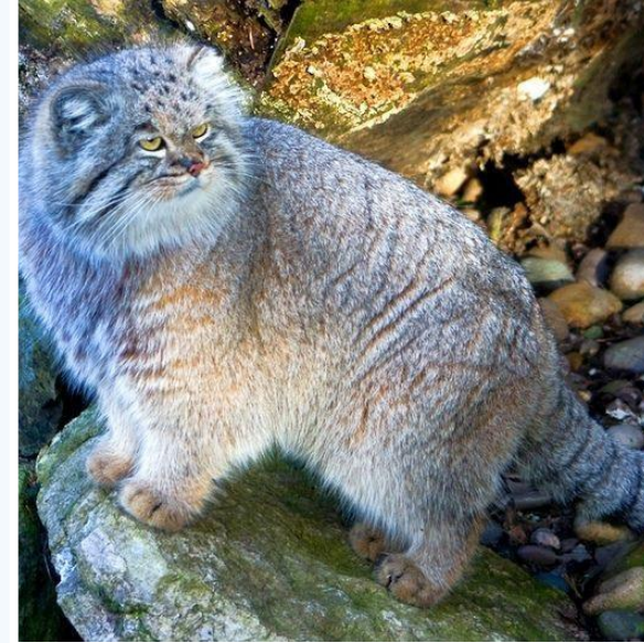
Степная кошка манул