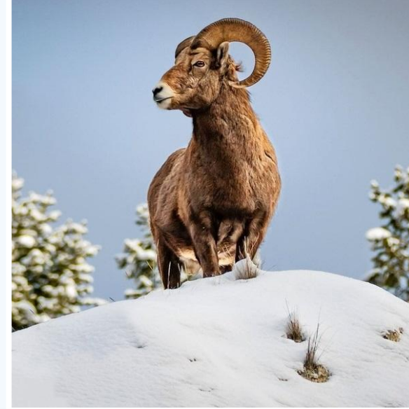
Горный баран аргали