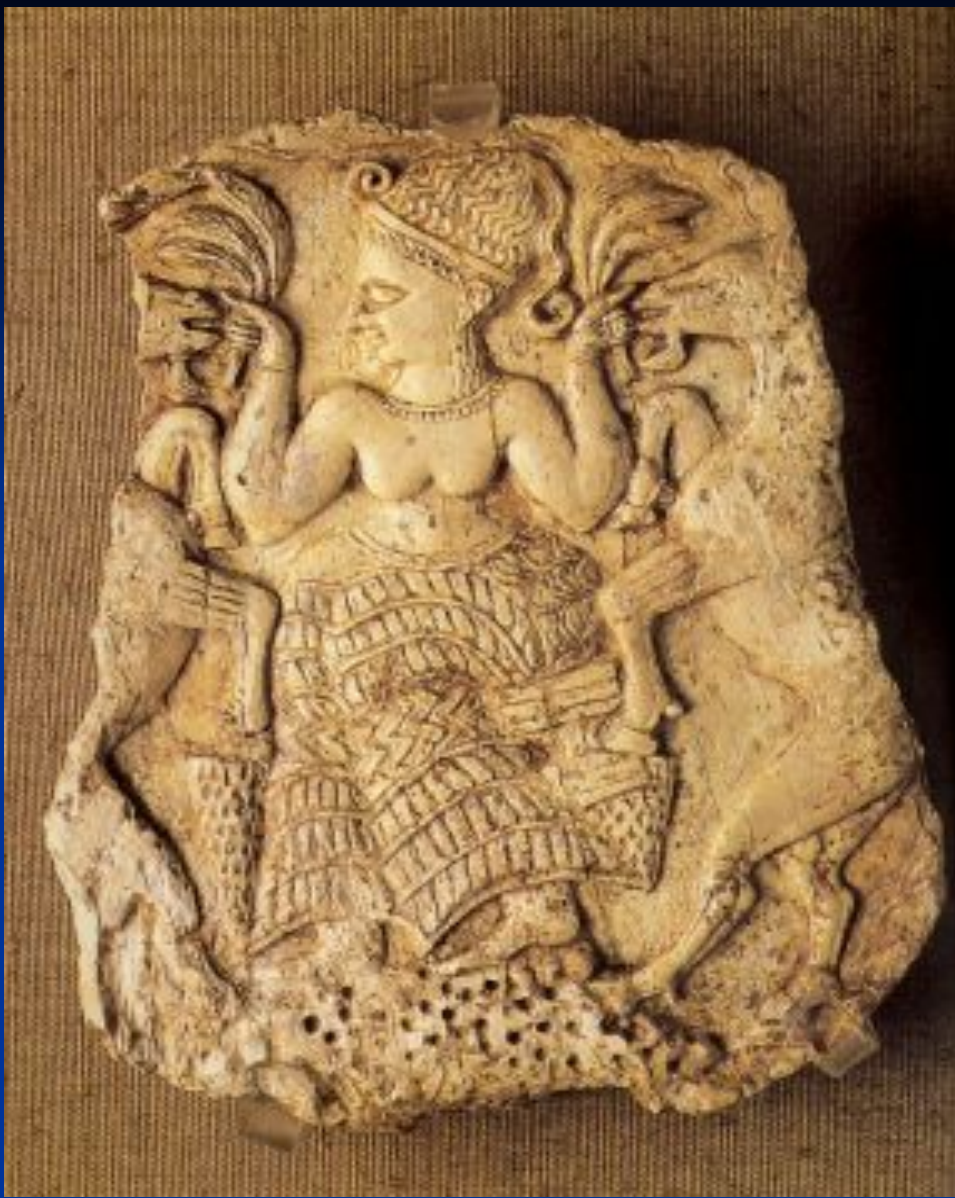
Богиня плодородия, кормящая козлов. 14 век до н.э.

Мелкие города- государства с прилегающими к ним землями имели своего владыку и покровителя – какое- либо божество плодородия, входившее в многочисленный пантеон богов. В отличие от Др. Египта, человек Др. Месопотамии не слишком беспокоился о загробной жизни, гораздо больше его прельщали сиюминутные радости земной жизни.