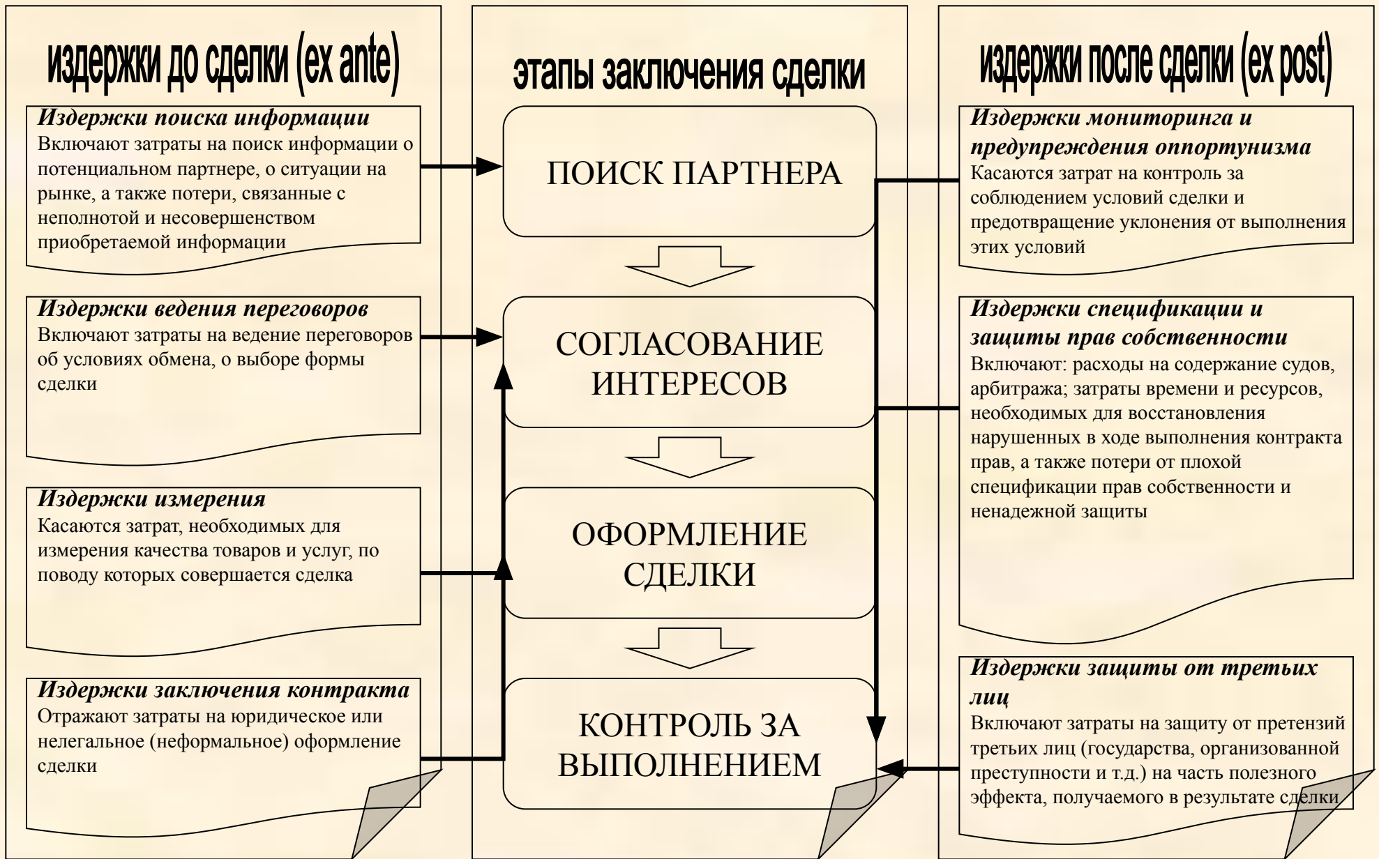
Рис. Классификация транзакционных издержек и этапы заключения сделки по Д.Норту и Т.Эггертссону в интерпретации О. Уильямсона, А.Н. Олейника, И.С. Пыжева