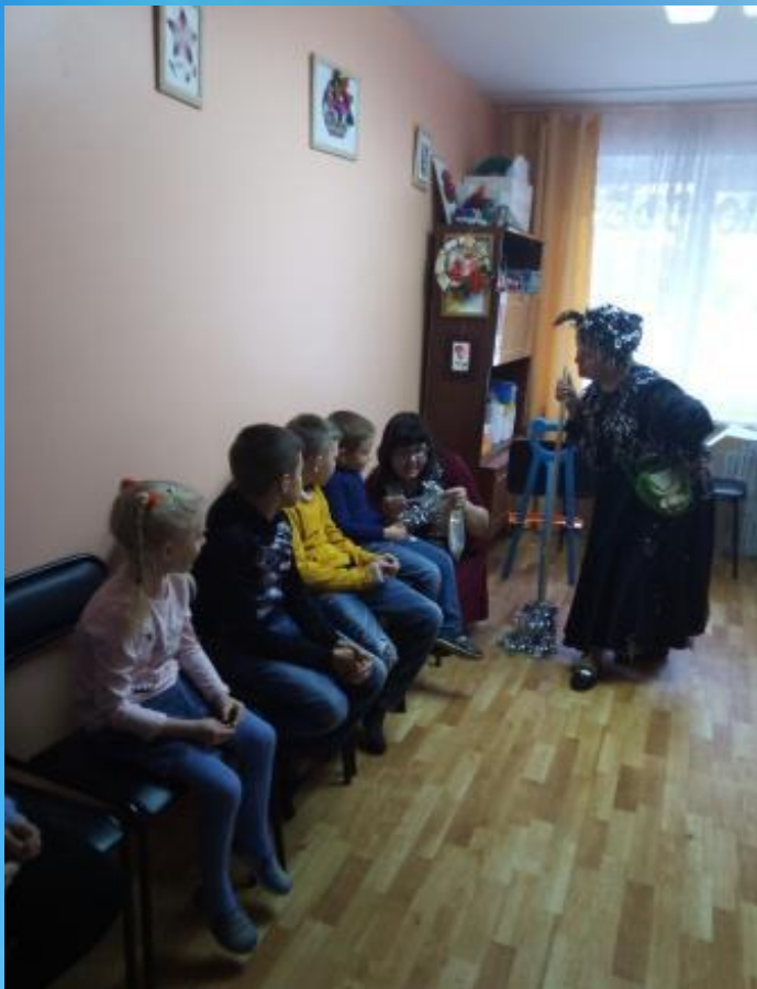
« Скорю, скоро Новый год»