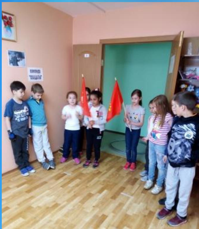
«Мы этой памяти верны»