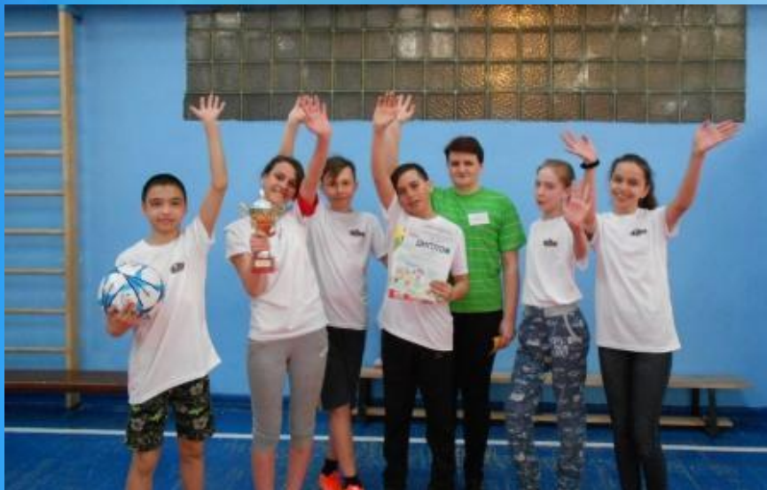
«Сила. Грация. Красота!»