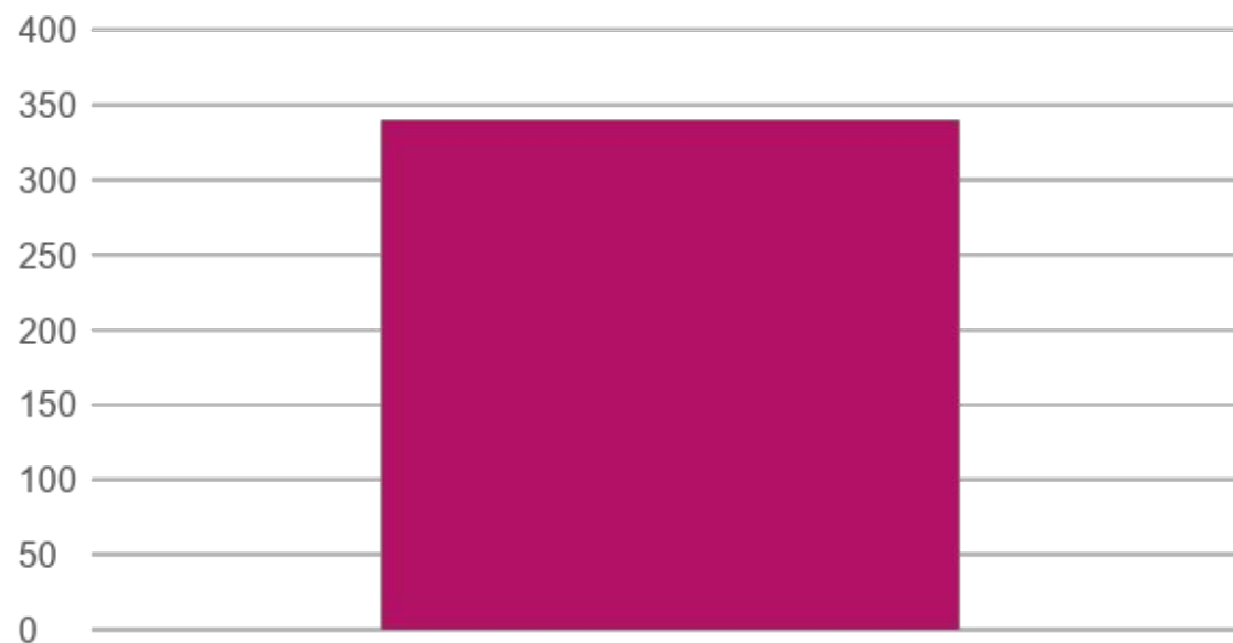
Насыщенность периодической печатью на 1000 жителей