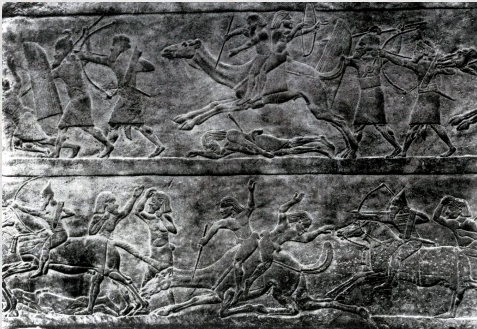
Битва на верблюдах