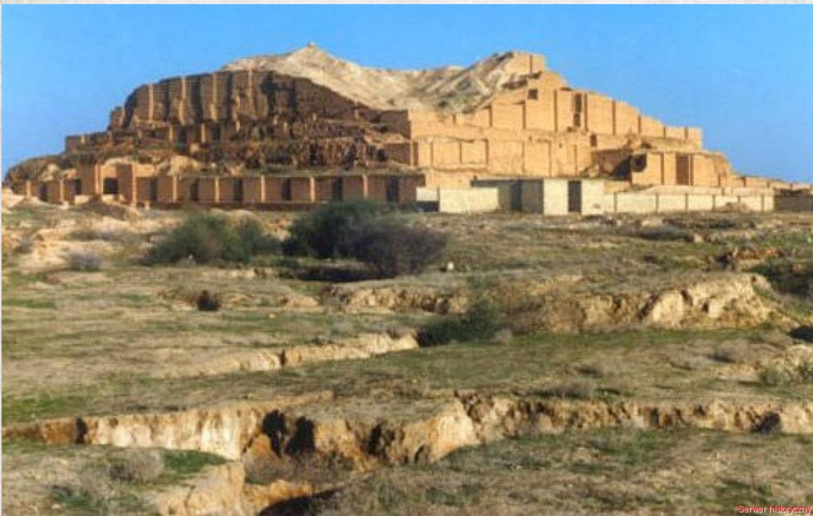
Зіккурат в Чога- Замбіле