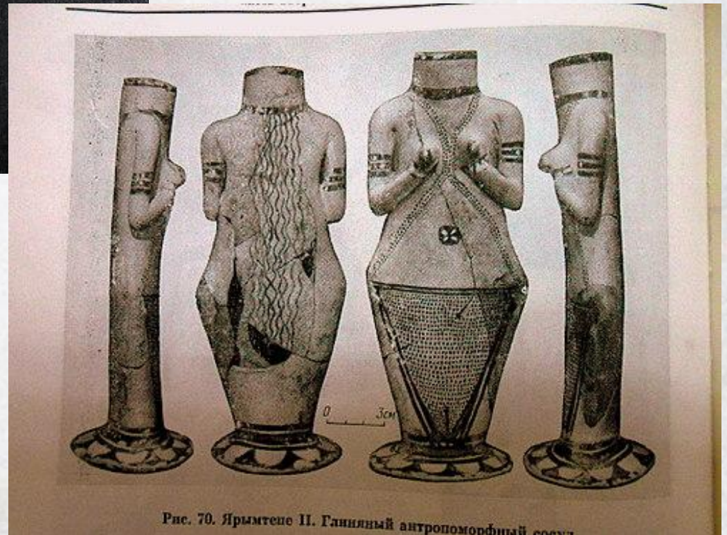
Рис. 70. Ярымтеш II. Глиняный антропоморфный сосуд

В епоху неоліту поширеними були антропоморфні глиняні посудини. В основному вони виготовлялися у формі обезголовленої жінки.