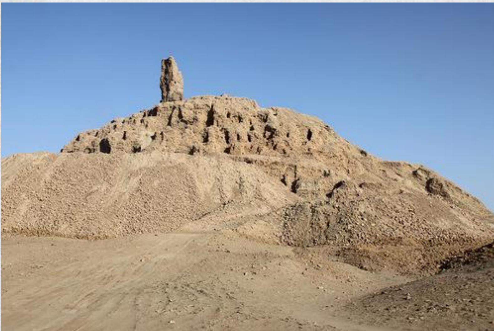
Зіккурат в Борсиппі