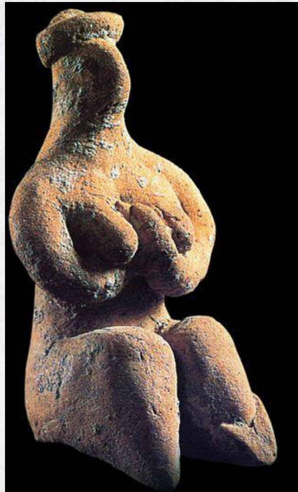
(Жіноча фігурка із Ель-Убейда. Глина. IV тыс. до н.е.)