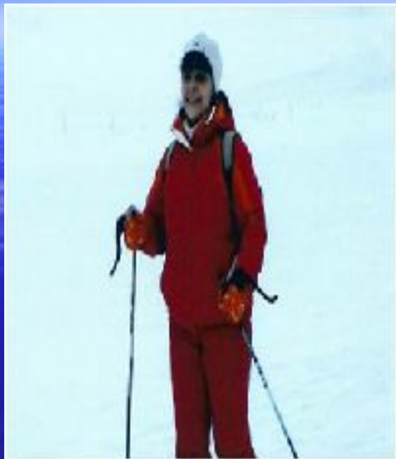
На лыжной прогулке

В этой роли совмещено все: заботы о доме, о моих детях, любимые занятия: туризм, прогулки, вязание и кулинария. Все это я делаю для самых близких