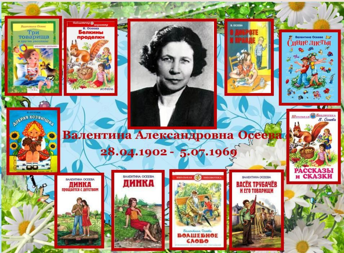
Валентина Александровна Осеева 28.04.1902 - 5.07.1969

Прочитай вопросы к рассказу, подумай над ответами.