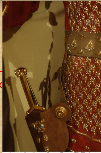
Фрагмент «Золотой человек» - Некроль Шиликты. VIII – VII вв. до н.э.