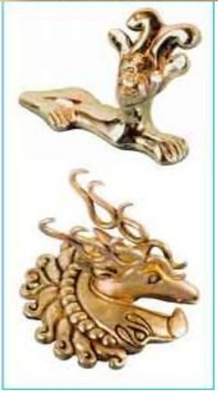
Сфинкс и олень, украшавшие нагрудник конской сбруи.