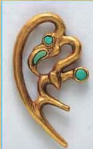
Золотой Семиург (сказочный орел)