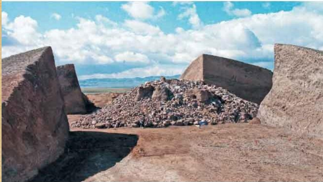
Почвенный слой под каменным курганом. Байгетобе.