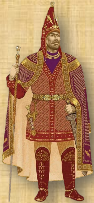
«Шиликтинский золотой человек» Реконструкция профессора А. Толеубаева