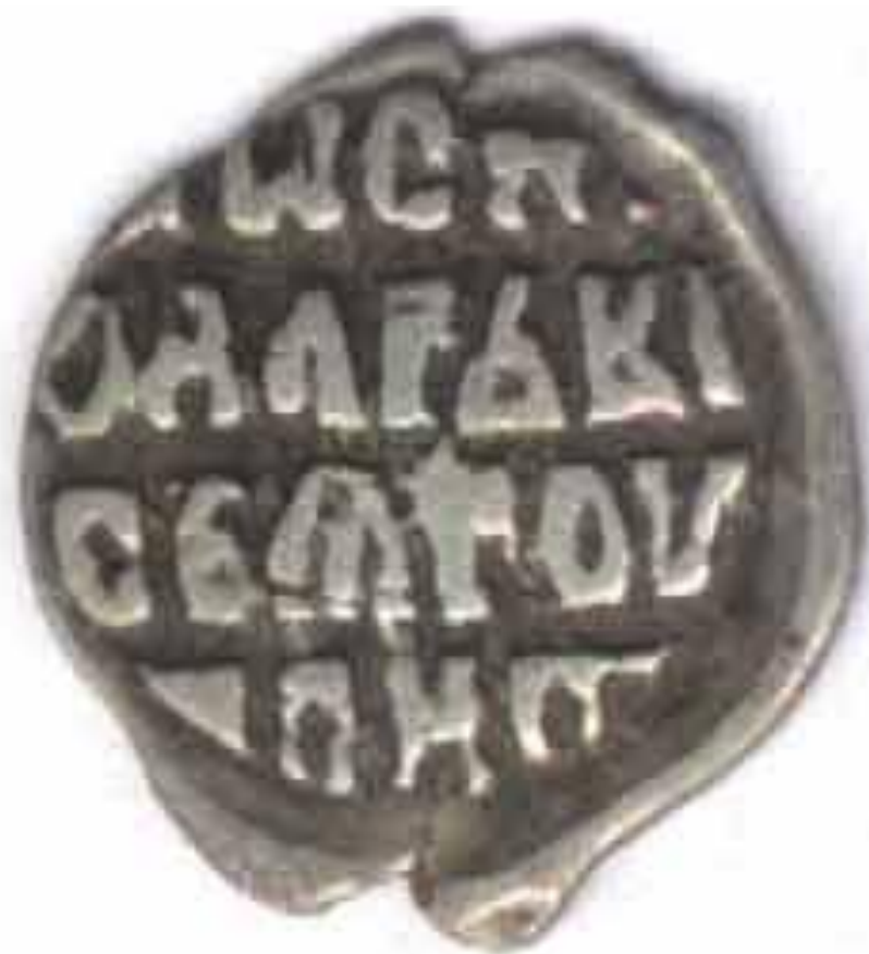
Серебряная деньга («московка»), 1535, Тверь