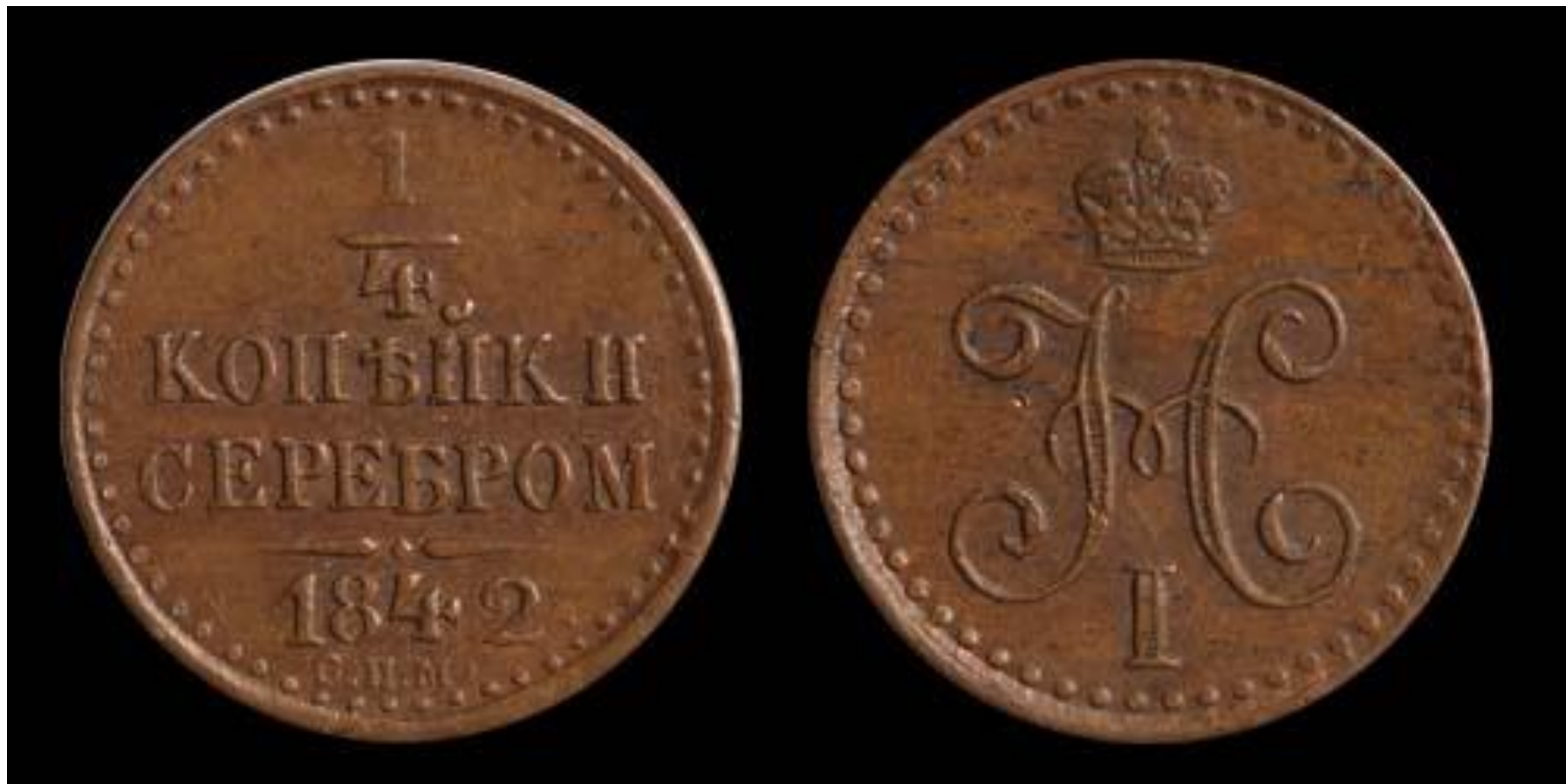
1/4 копейки полушка серебром, Николай I, 1842, медь