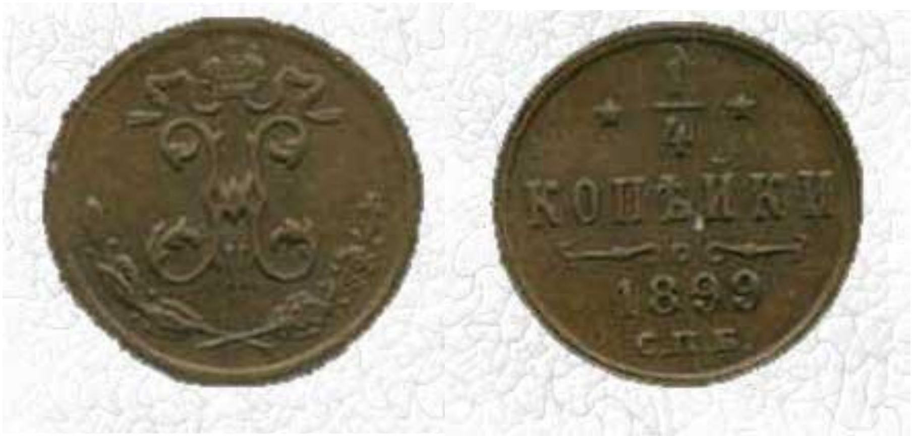
1/4 копейки , Николай II, 1899