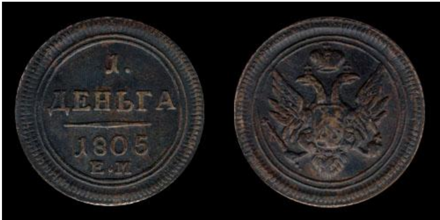
Деньга Александра I 1805, медь