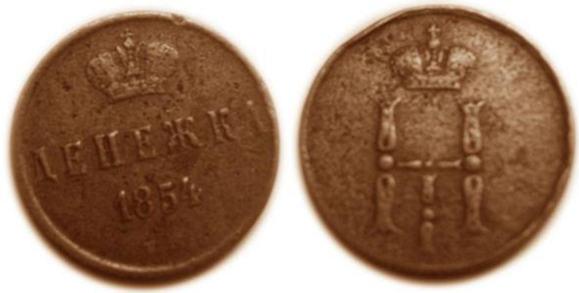
Медная денежка , 1854