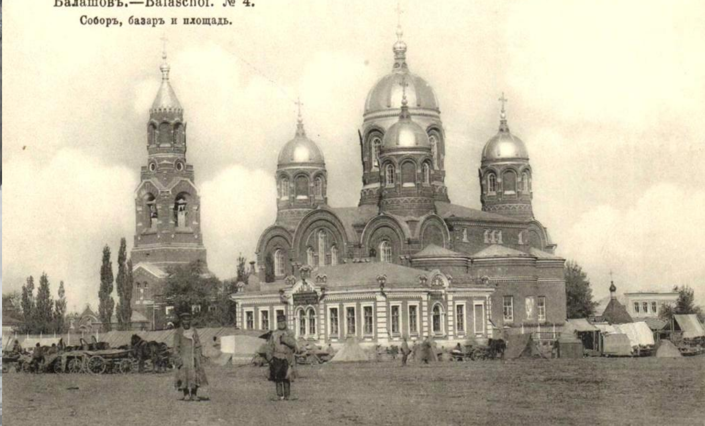
Балашовъ.—Balaschof. № 4. Соборъ, базаръ и площадь.

Мы находимся на месте, где до революции стоял Троицкий собор. Там, где находился главный алтарь собора в парке им. Куйбышева установлен покаянный крест. Троицкий собор – это монументальный, пятипрестольный, пятиглавый красавец с четырехъярусной вертикалью колокольни. Он возвышался над базарной площадью с 1886 года. Но в 1936 году его вероломно взорвали.