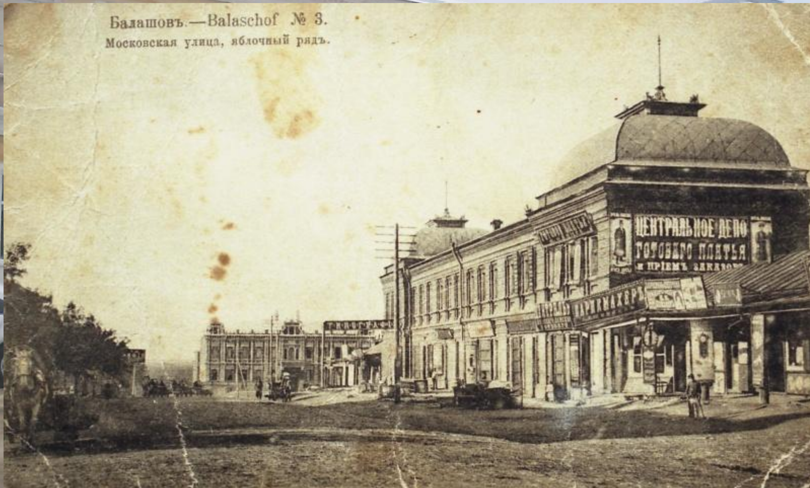
Балашовъ.—Balaschof № 3. Московская улица, яблочный рядъ.

Это наш кинотеатр «Победа», который мы любим и часто посещаем. В нем 270 посадочных мест, ежедневно демонстрируются до 8 сеансов. Он был построен в 1906 году как центральное депо готового платья, хозяином которого был уроженец Витебской губернии Матвей Шехтер.