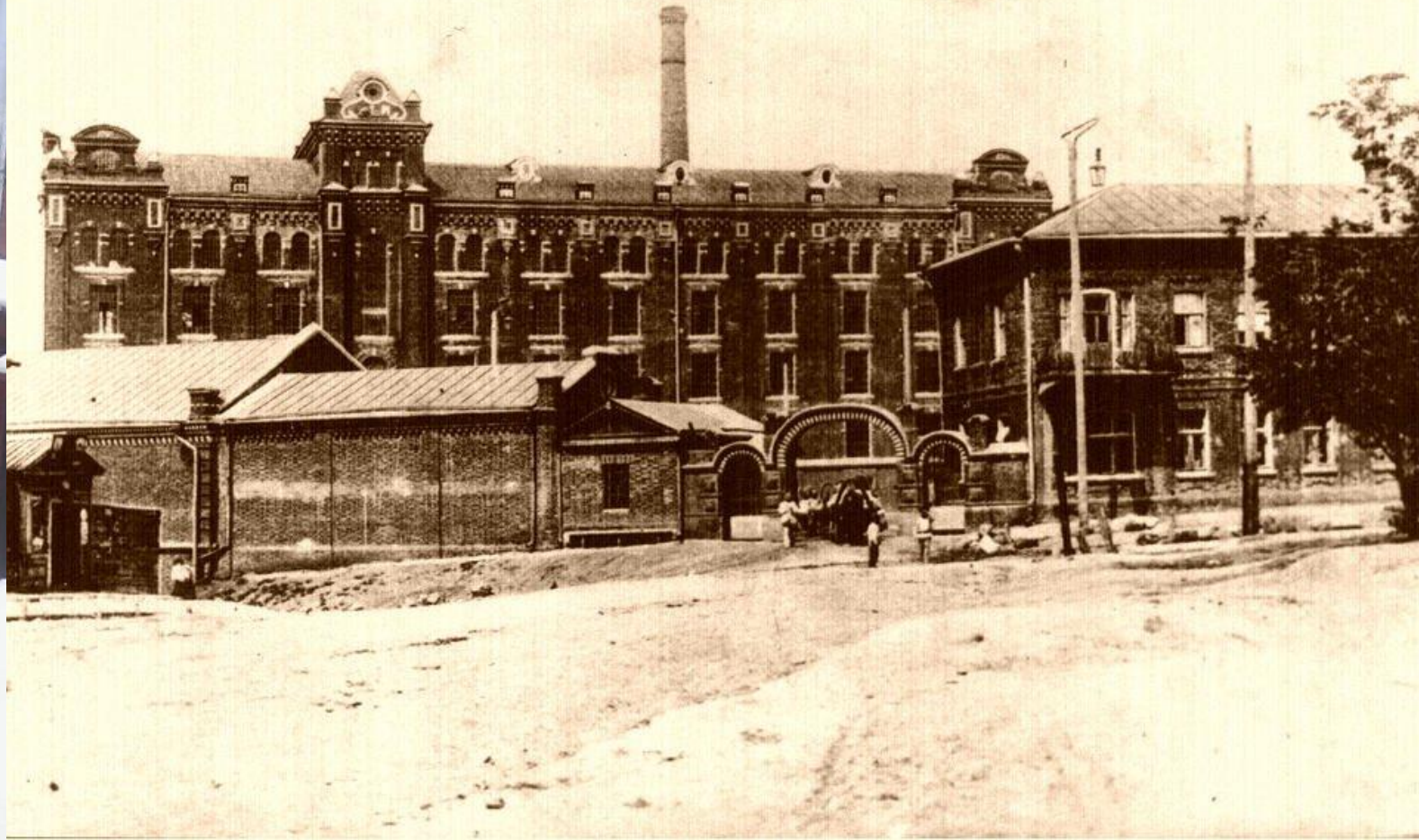
Г. БАЛАШОВЪ. Мельница 2 го Товарищества.

В 1906 году товарищество по устройству мукомольных мельниц на паях "Антон Эрлангер и Ко" построило в Балашове мельницу II товарищества мукомолов. Комплекс мукомольного завода считается памятником промышленной архитектуры и входит в список объектов культурного наследия регионального значения.