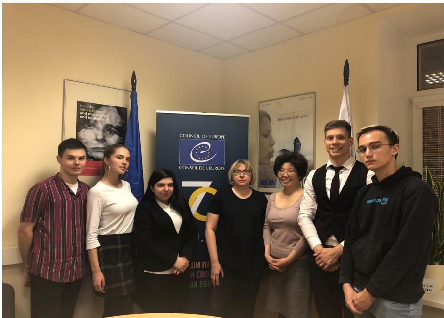
в Программном офисе Совета Европы в РФ