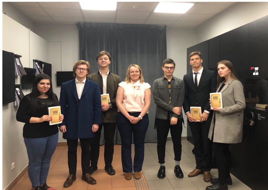
в Правозащитном центре «Мемориал»