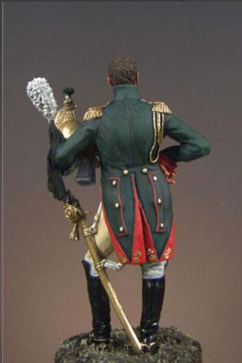
Полковник драгун Императорской гвардии