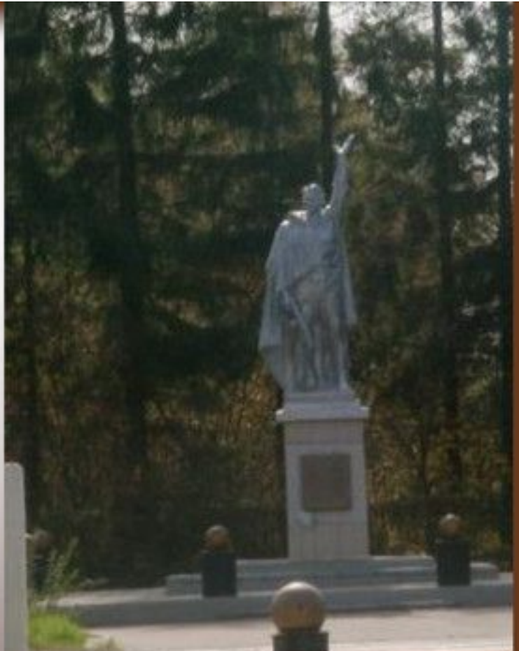
Памятник неизвестному солдату на кургане славы города Алексина Тульской области