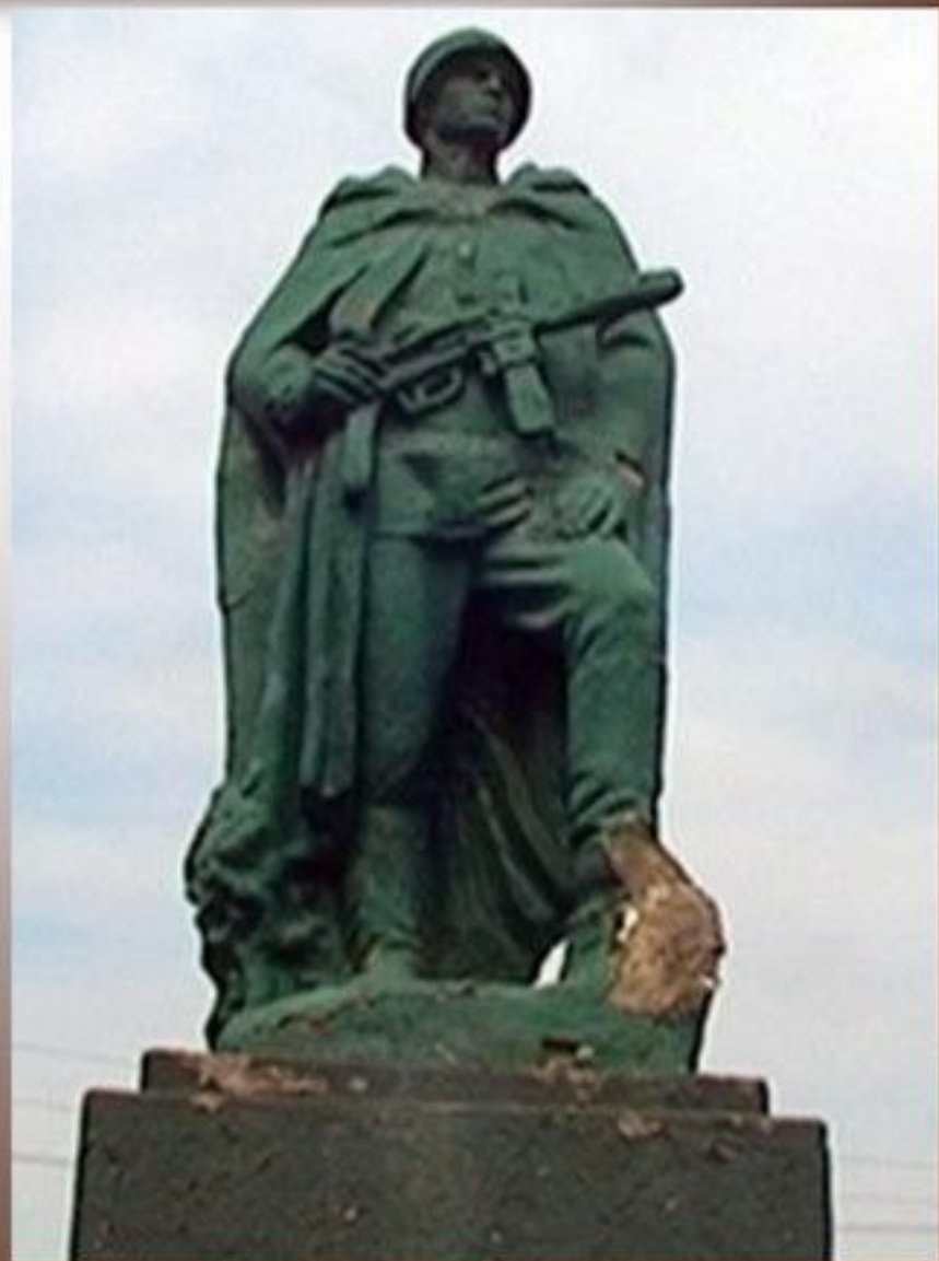
Памятник в Новокузнецке