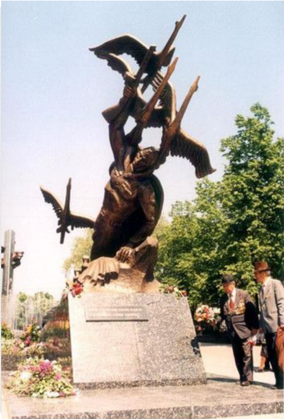
Мемориальный комплекс Героям Великой Отечественной войны, памятник Неизвестному солдату. Луганск