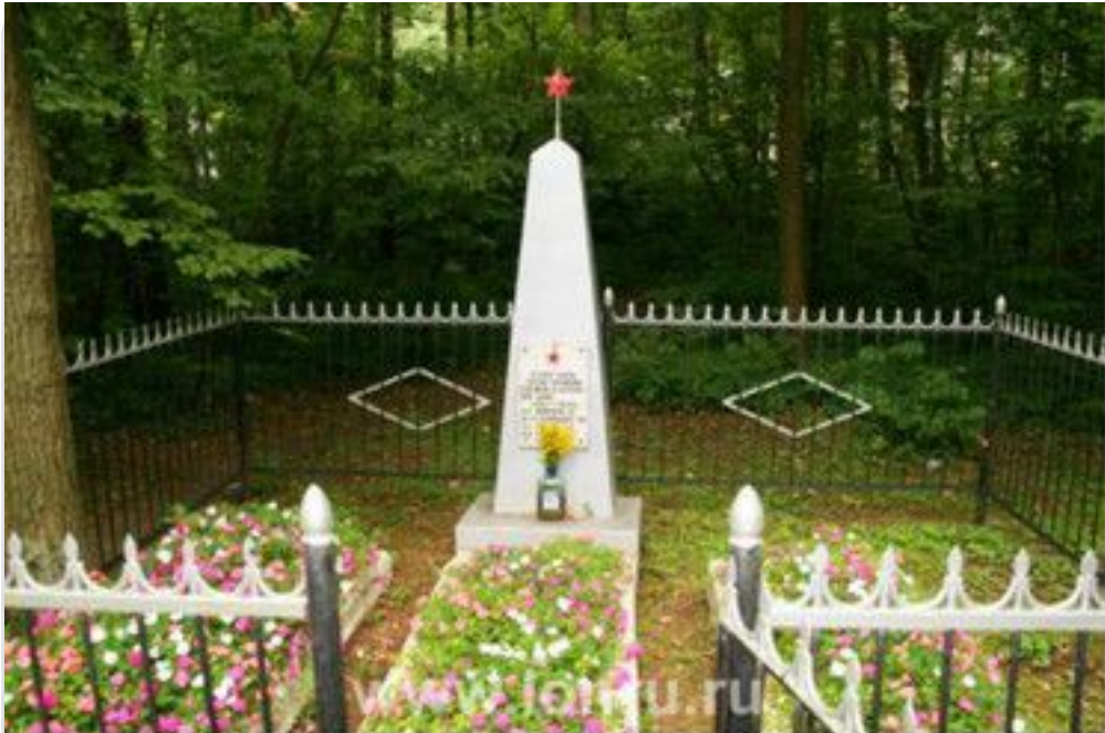
Жуковка - могила неизвестному солдату , погибшему во время Великой Отечественной войны