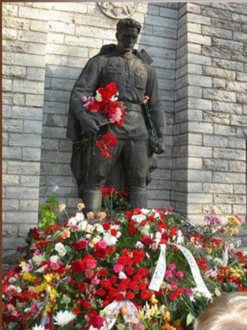
Памятник неизвестному солдату в Таллинне (до апрельских событий)