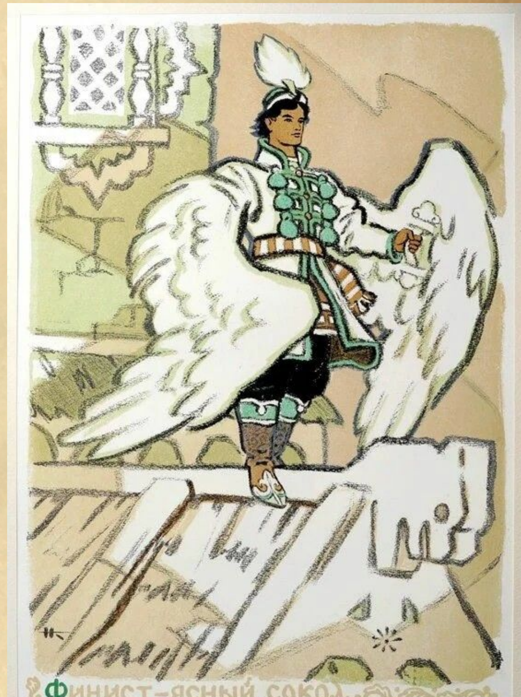
Финист - ясный сокол