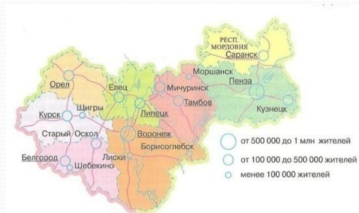
Рис. 75. Центральнo-Черноземный район