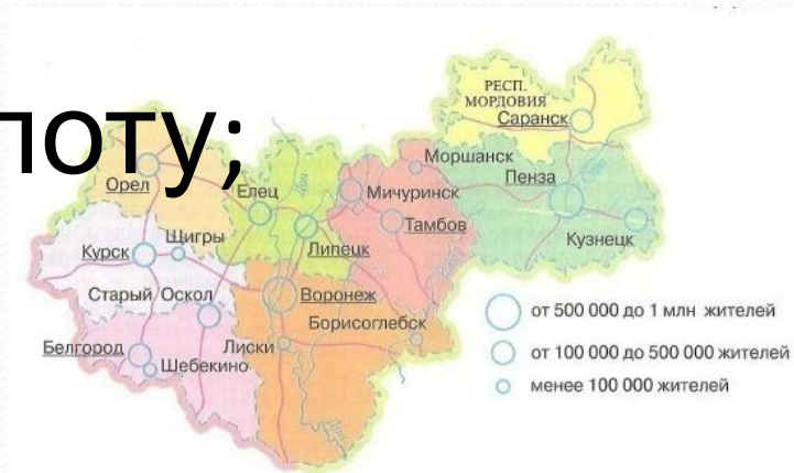
Рис. 75. Центрально-Черноземный район