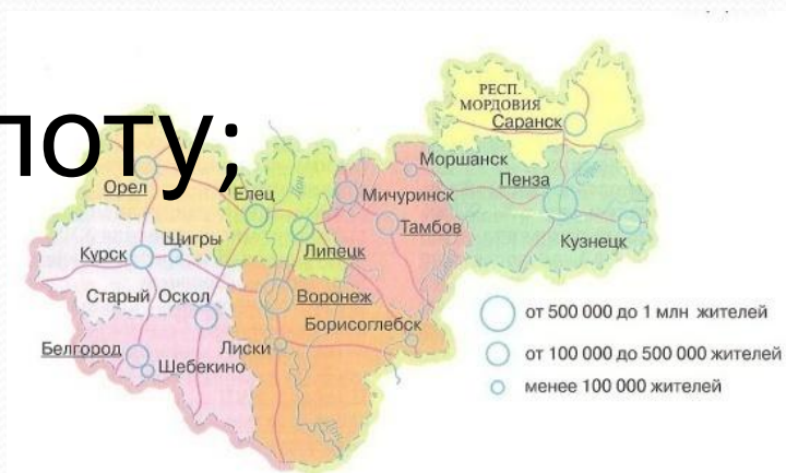
Рис. 75. Центрально-Черноземный район