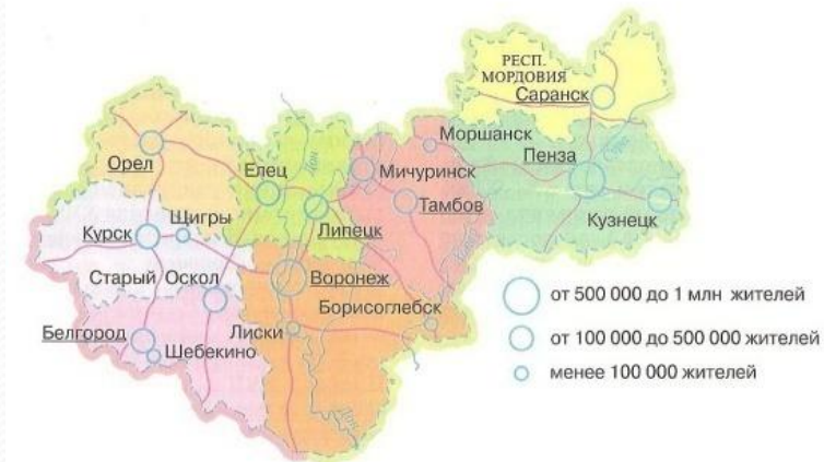
Рис. 75. Центрально-Черноземный район