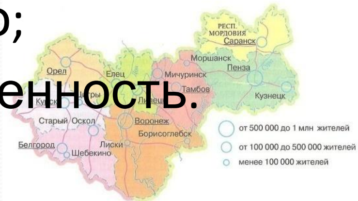
Рис. 75. Центрально-Черноземный район