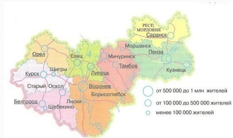
Рис. 75. Центрально-Черноземный район