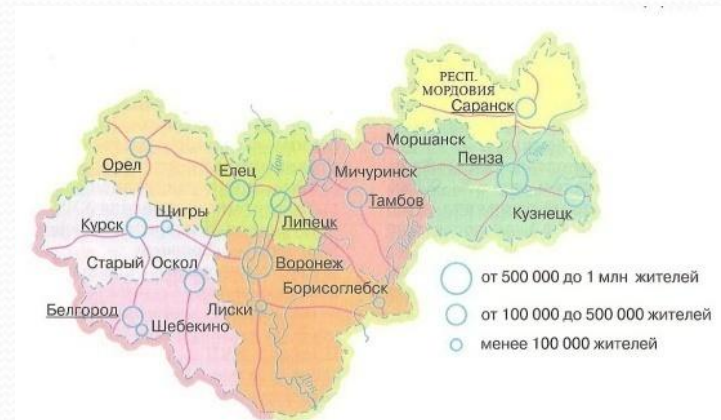
Рис. 75. Центральнo-Черноземный район