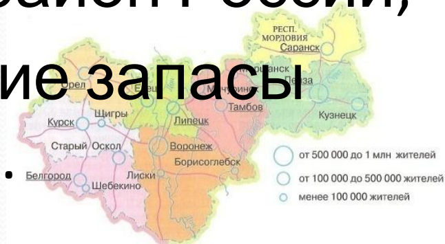
Рис. 75. Центрально-Черноземный район