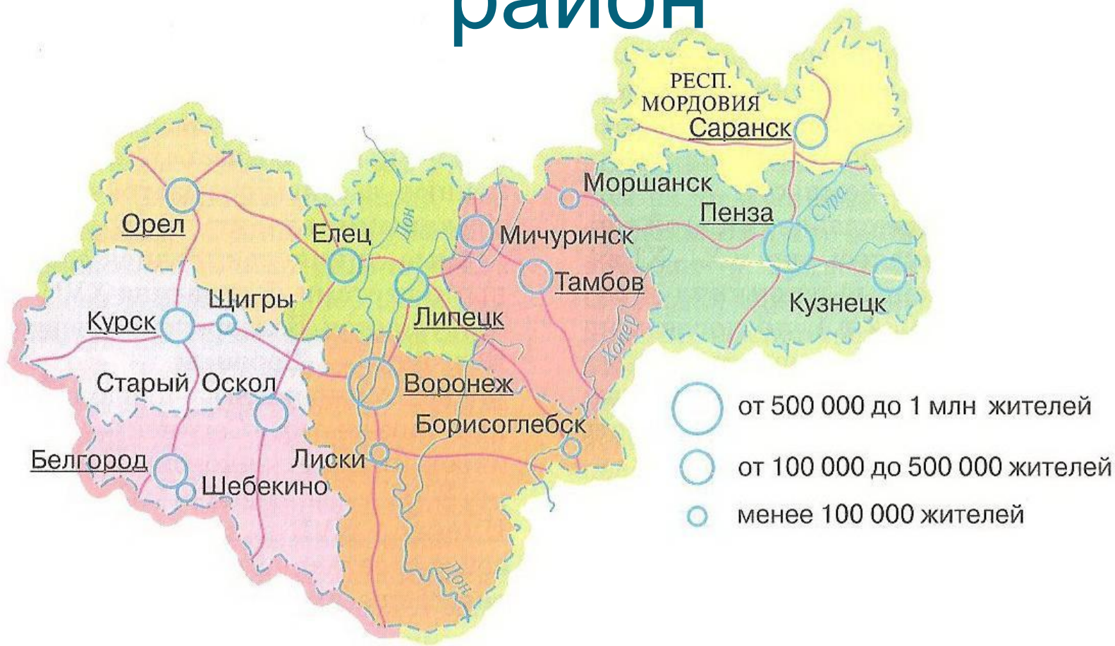
Рис. 75. Центрально-Черноземный район