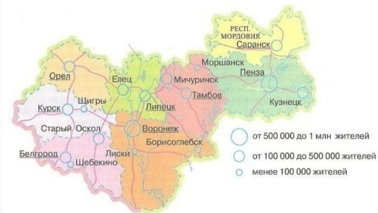
Рис. 75. Центрально-Черноземный район