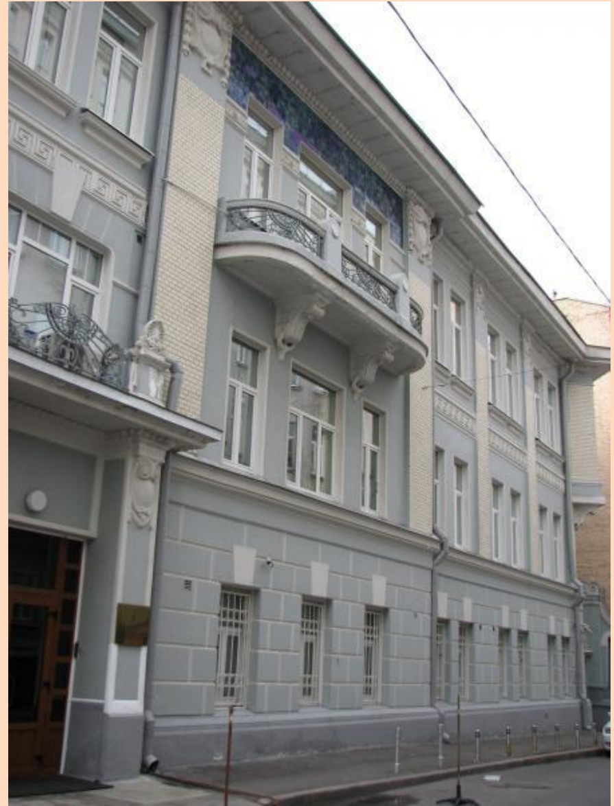
М. Г. Гейслер. Дом Тарасова в Скатерном переулке. 1907 г.