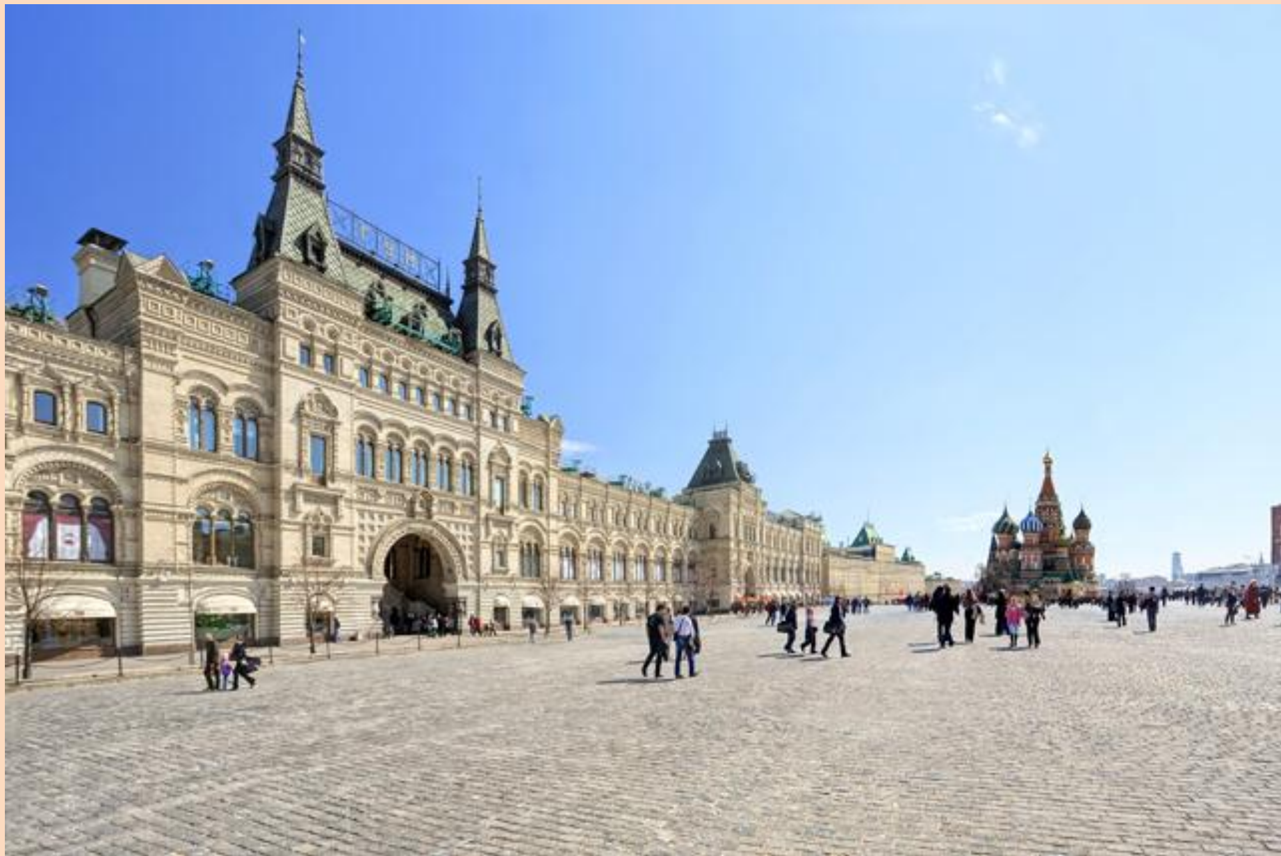
А.Померанцев. «Торговые ряды». ГУМ.