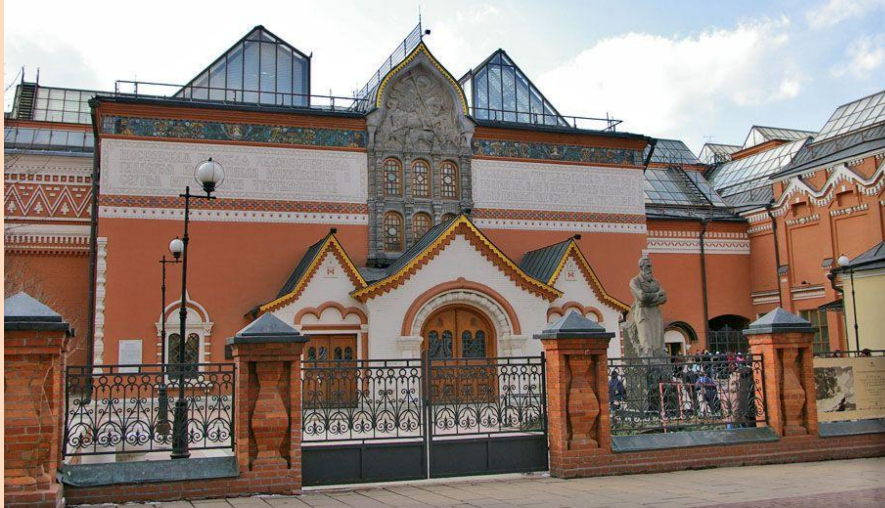
Третьяковская галерея. Дом куплен П.М. Третьяковым в 1851 г. Фасад разработан в 1900—1903 г.г. архитектором В. Н. Башкировым по рисункам художника В. М. Васнецова.