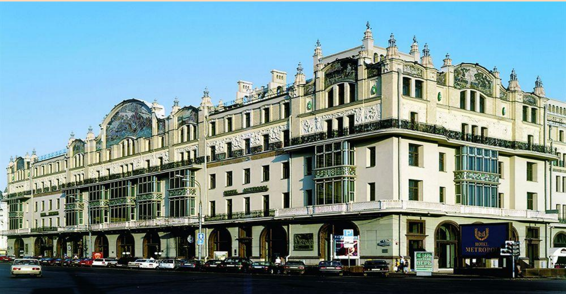
Вильям Валькотт. Гостиница Метрополь. 1895 – 1901 г. г.