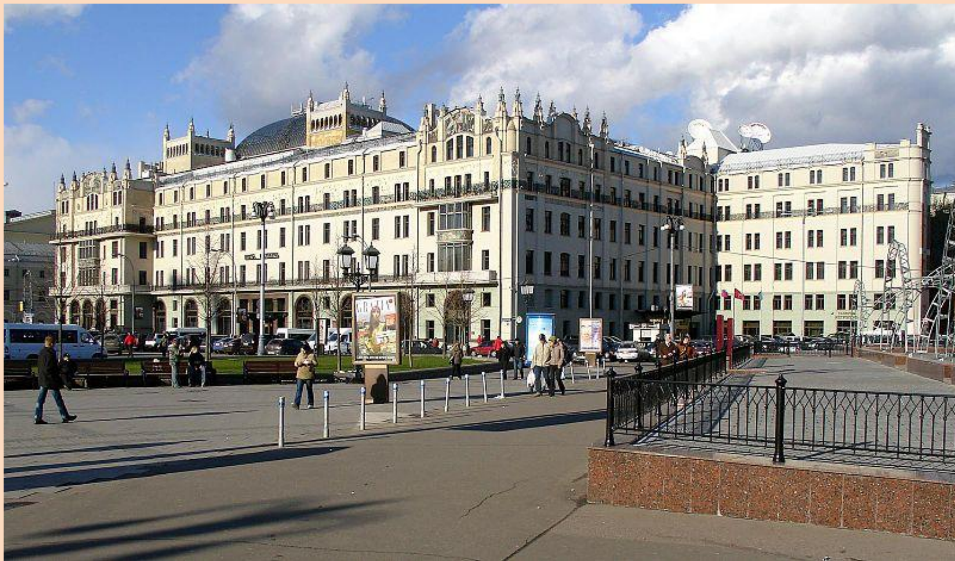
Вильям Валькотт. Гостиница Метрополь. 1895 – 1901 г. г.