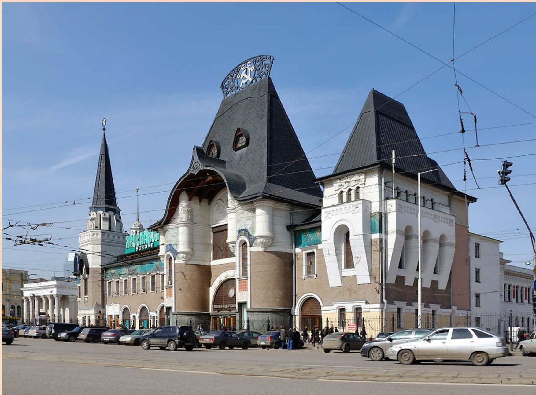
Ярославский вокзал. | Перестроен Ф.О.Шехтелем в 1902 – 1904 г.