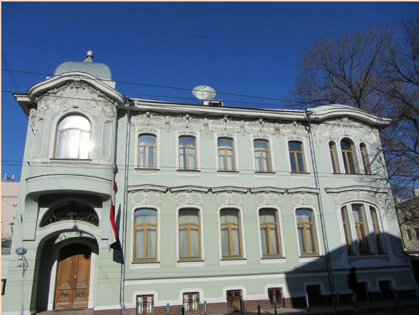
Г.А. І ельрих. Особняк Якова РеккаСтиль. (Франко-бельгийский модерн) 1902 – 1903 г.