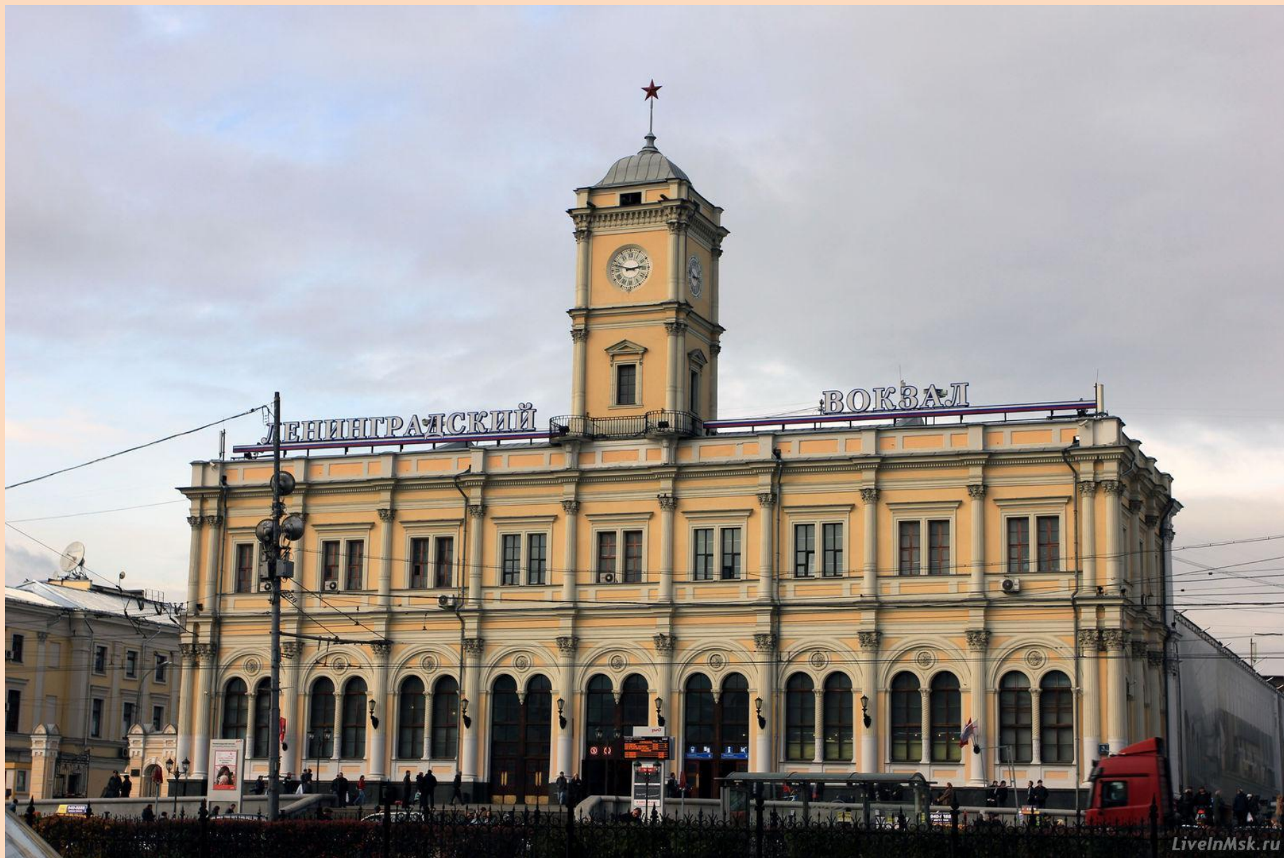
К.А. Тон. Ленинградский вокзал. 1849 г.