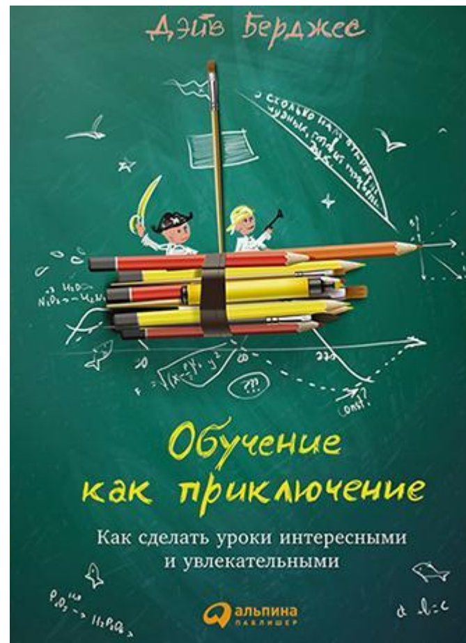
Дэйв Берджес. «Обучение как приключение», 2015