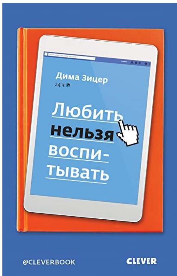
Дима Зицер. «Любить нельзя воспитывать», 2018