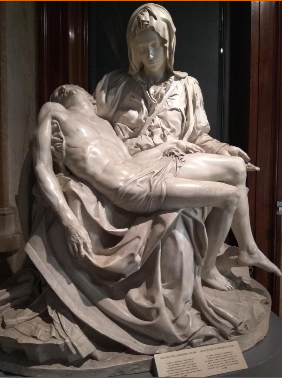
SCULTURA DELLA PIETÀ DI MICHELANGELO (1499-1501) L'opera, commissionata da Francesco de' Medici, fu scolpita in un unico blocco di marmo di Carrara nel 1499. È conservata a Firenze, nella Basilica di Santa Croce, nella cappella di San Tommaso. È stata restaurata nel 1904 e nel 1970. È stata restaurata nel 1970 e nel 1970. È stata restaurata nel 1970 e nel 1970.