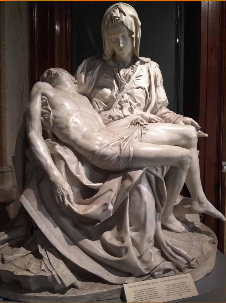
SCULTURA DELLA PIETÀ DI MICHELANGELO (1498-1501) L'opera, commissionata da Giovanni di Duccio, fu scolpita in un unico blocco di marmo di Carrara nel 1498. È conservata a Firenze, nella Basilica di Santa Maria della Spina, dove fu collocata nel 1521. È considerata una delle opere più commoventi della scultura rinascimentale.