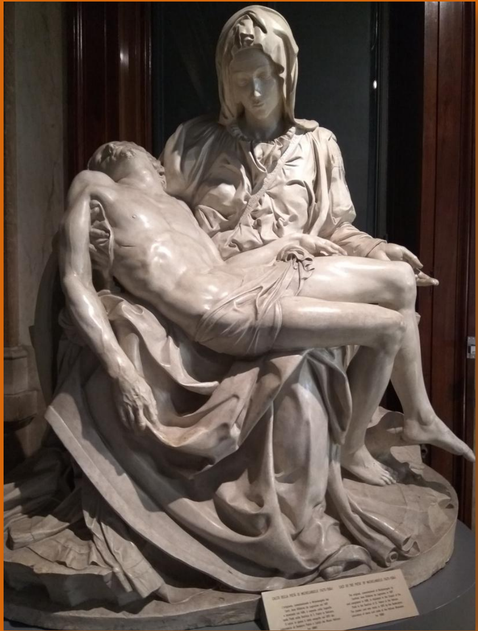
SCULTURA DELLA PIETÀ DI MICHELANGELO (1498-1501) L'opera, commissionata da Francesco de' Medici, fu scolpita in un unico blocco di marmo di Carrara nel 1498-1501. È conservata nella Basilica di Santa Maria della Spina, a Firenze, nella cappella di San Jacopo. È stata restaurata nel 1970-72. È conservata nella Basilica di Santa Maria della Spina, a Firenze, nella cappella di San Jacopo.