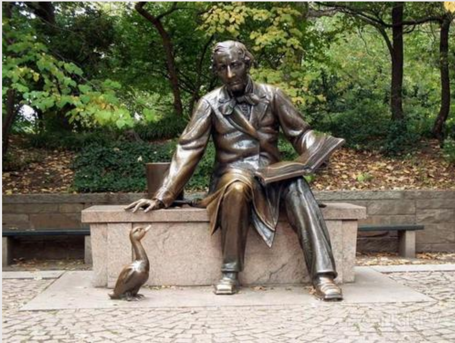
Андерсен и Гадкий утёнок, г. Нью-Йорк.