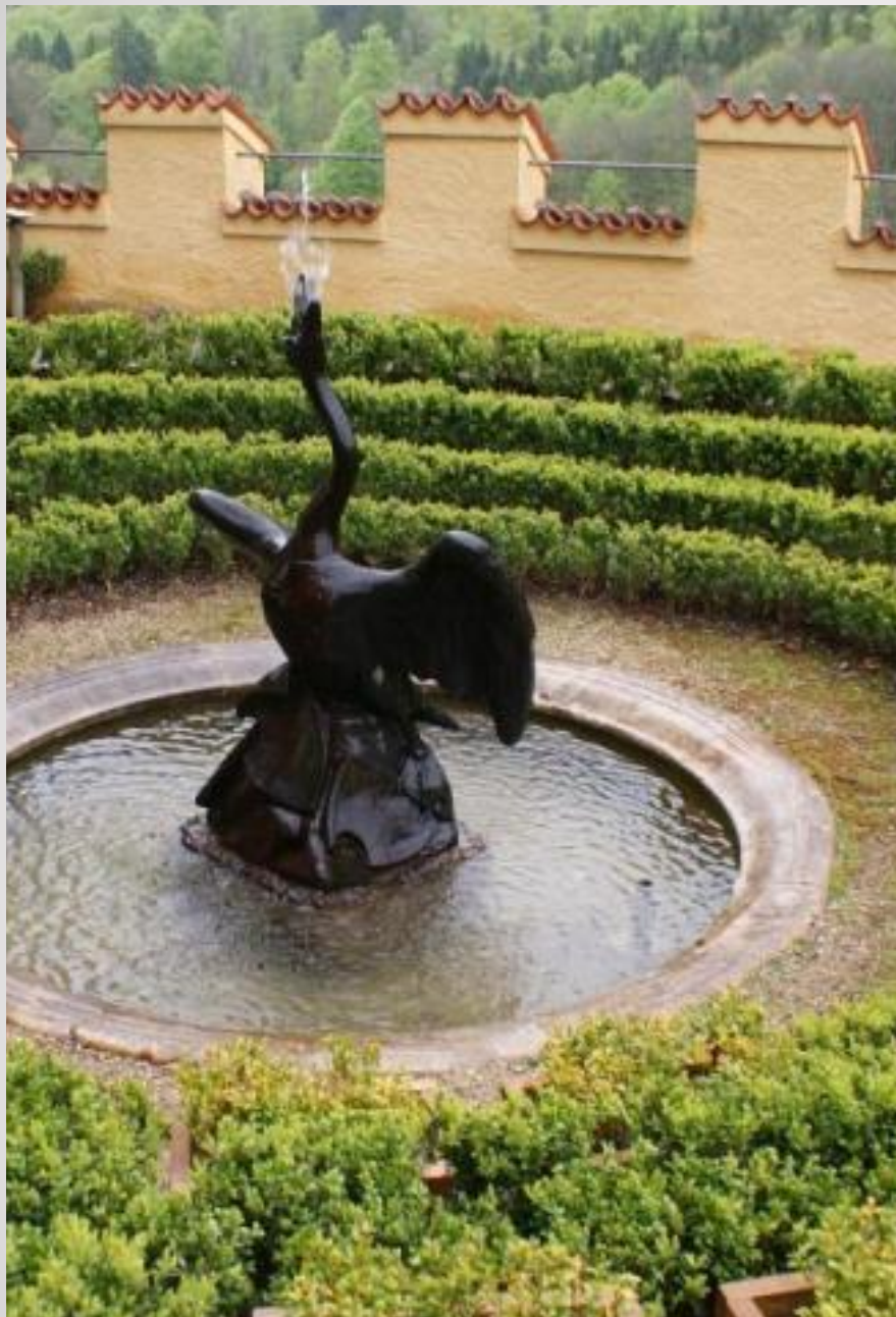
Памятник Прекрасному лебедю в г. Одессе.