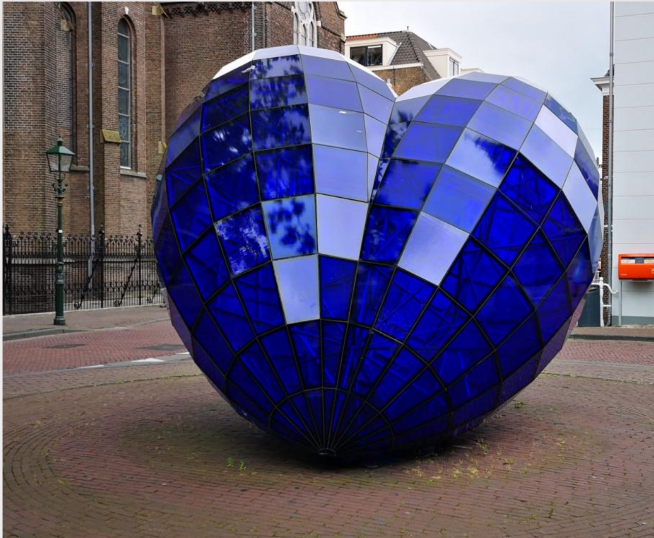
Стеклянная композиция «Сердце Снежной королевы» в г. Дельфт, Нидерланды.