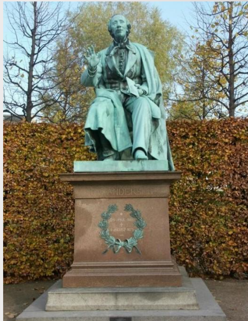
Памятник Андерсену в Копенгагене. Скульптор Аугуст Сабю, 1880 г.