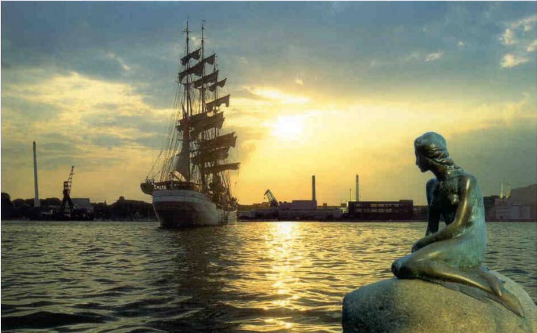
Памятник Русалочке в Копенгагене.