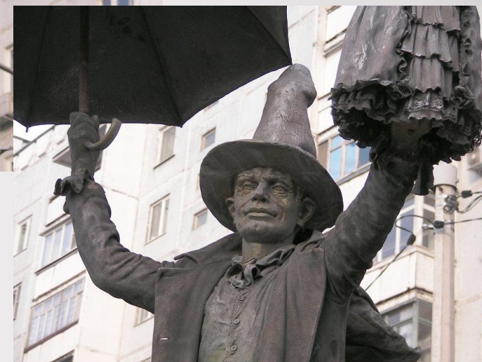
Оле-Лукойе, г. Мытищи, Московская область.