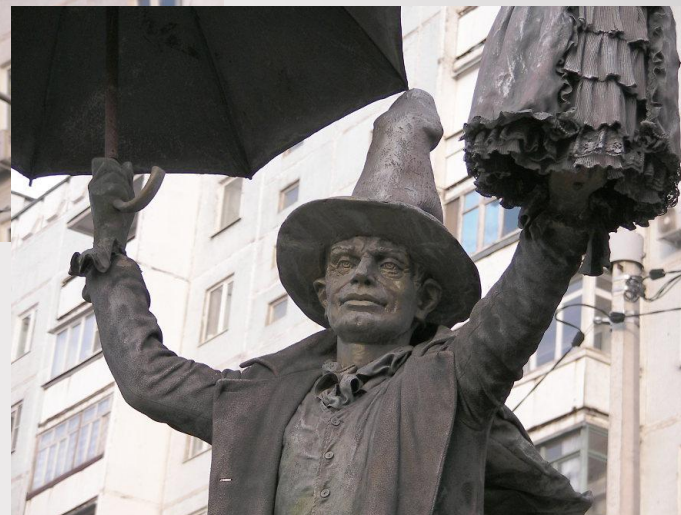
Оле-Лукойе, г. Мытищи, Московская область.