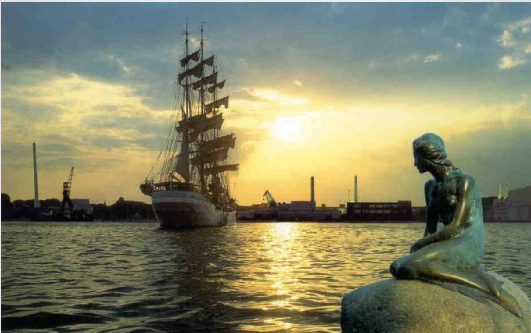
Памятник Русалочке в Копенгагене.