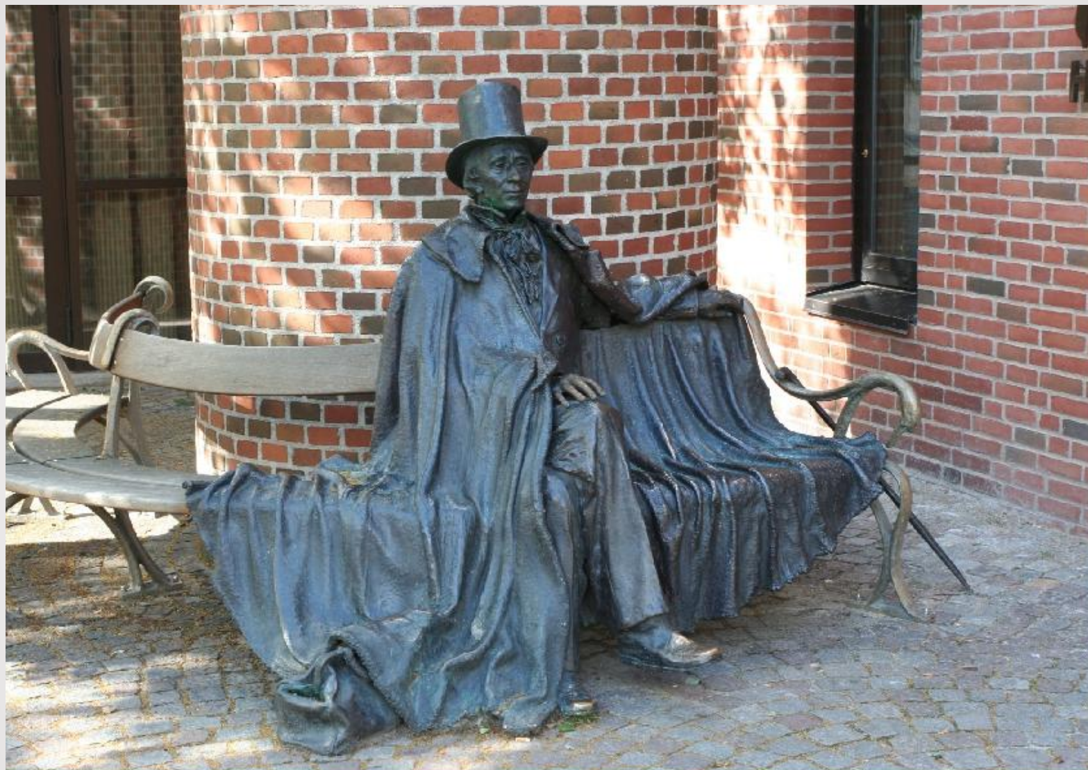
Памятник Андерсену в г. Оденсе, Дания.