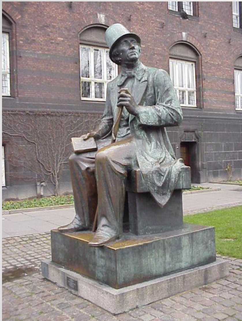
Памятник Андерсену в Копенгагене. Скульптор Хенри Луков-Нильсен, 1961 г.