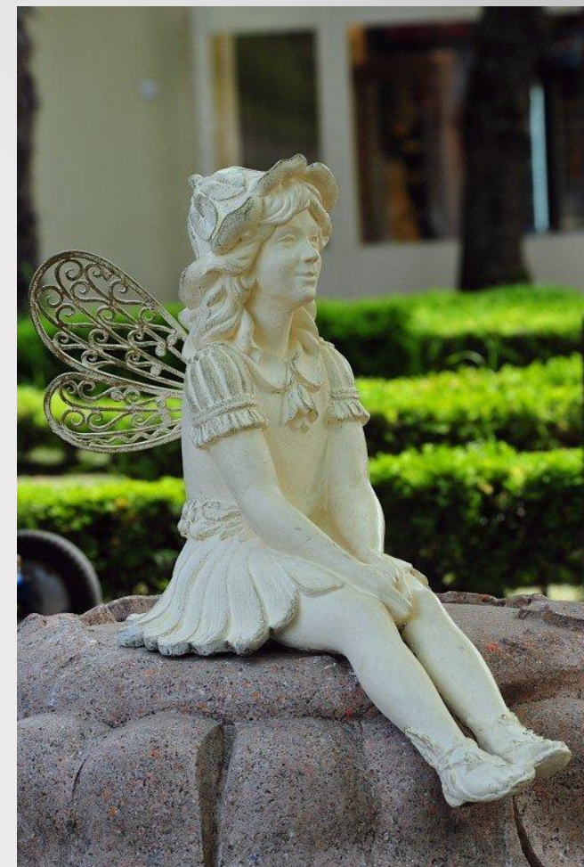
Памятники Дюймовочке в городах: Донецке, Оденсе и Сочи.