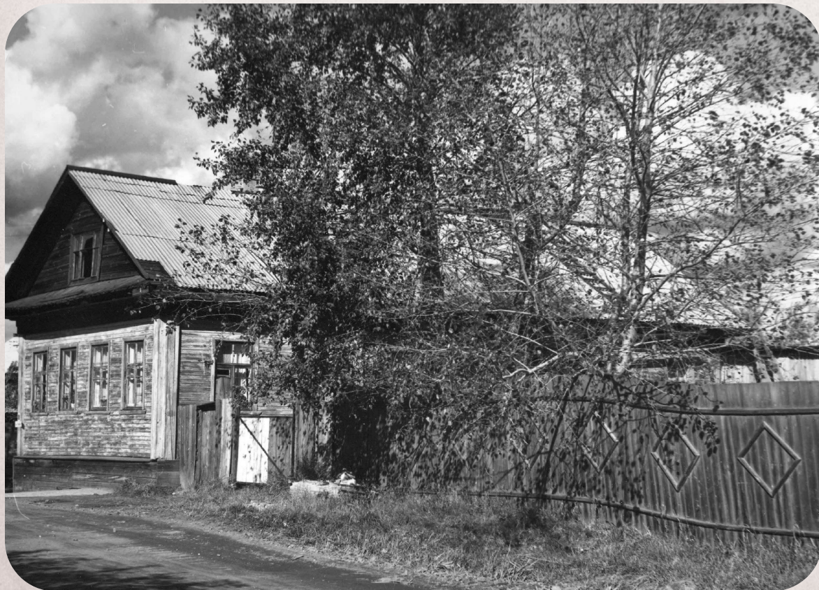
Штаб в Беломорске