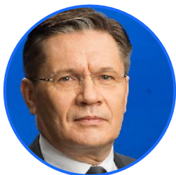
Алексей Лихачев Росатом Генеральный директор