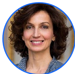
Одри Азуле ЮНЕСКО Генеральный директор