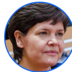
Кейт Рэворт Оксфордский и Кембриджский университеты Профессор и ведущий мировой экономист