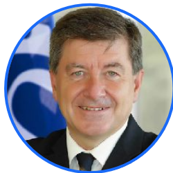
Гай Райдер Международная организация труда Генеральный директор