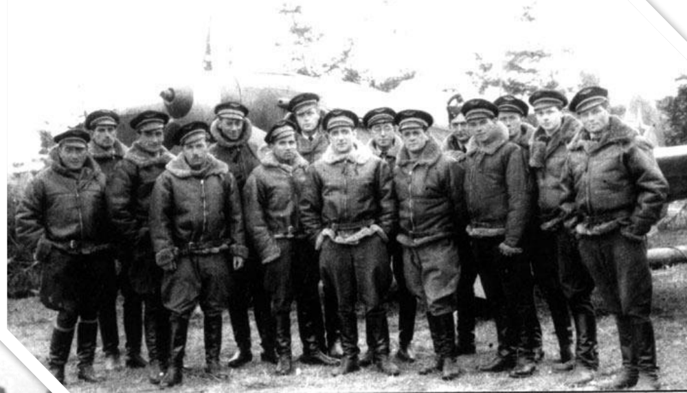
Личный состав авиаполка

Нормандия-Неман — французский истребительный авиационный полк, воевавший во время Второй мировой войны против войск стран оси на советско-германском фронте в 1943—1945 годах.