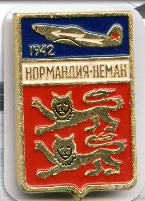
Герб провинции Нормандия

Полк принимал участие в Курской битве в 1943 году, Белорусской операции в 1944 году, в боях по разгрому немецких войск в Восточной Пруссии в 1945 году.