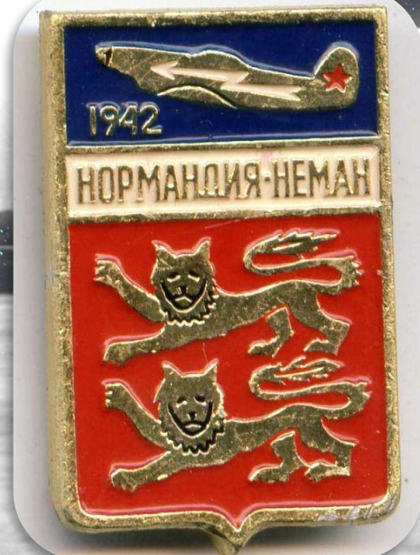
Герб провинции Нормандия

Полк принимал участие в Курской битве в 1943 году, Белорусской операции в 1944 году, в боях по разгрому немецких войск в Восточной Пруссии в 1945 году.