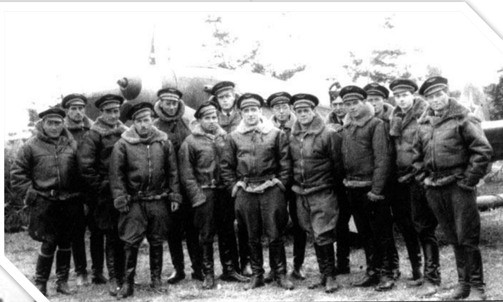
Личный состав авиаполка

Нормандия-Неман — французский истребительный авиационный полк, воевавший во время Второй мировой войны против войск стран оси на советско-германском фронте в 1943—1945 годах.