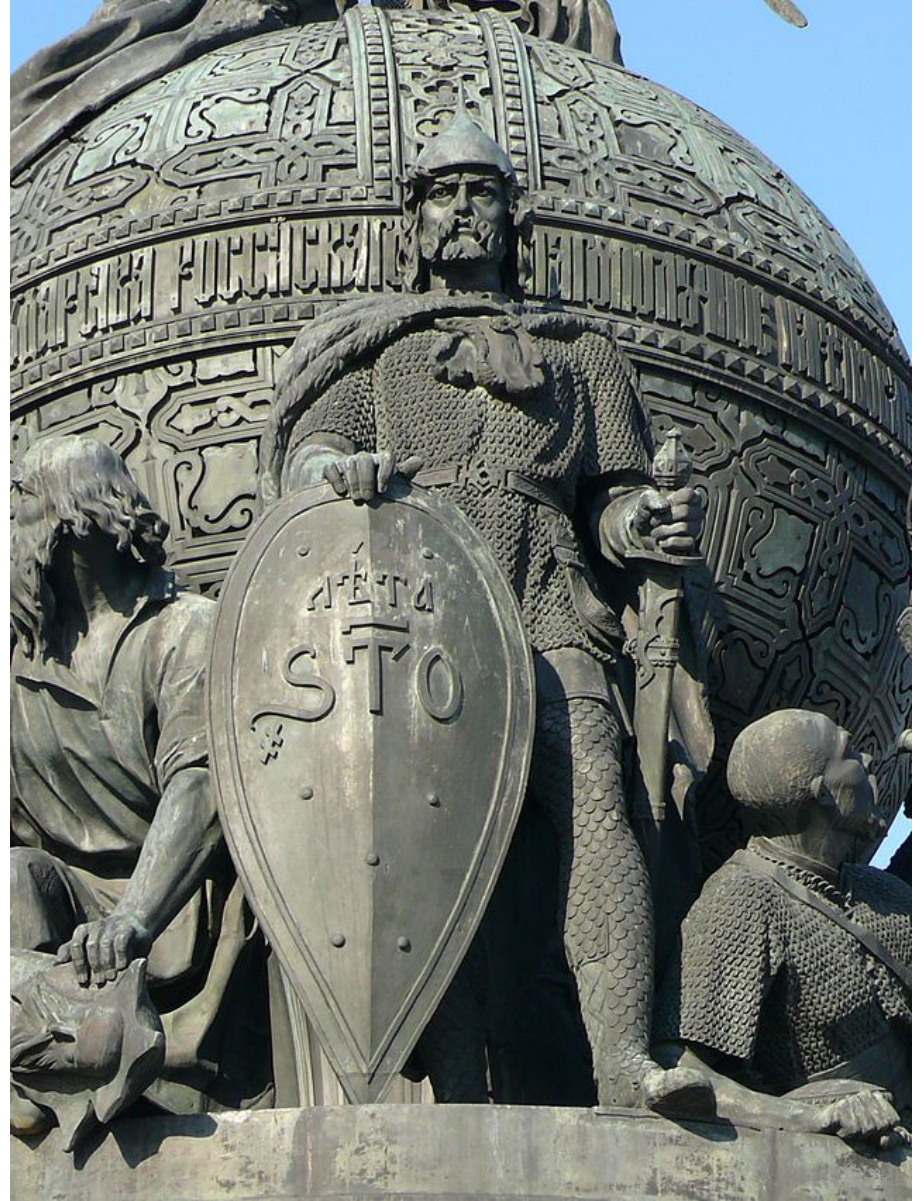
Рюрик на Памятнике «Тысячелетие России»