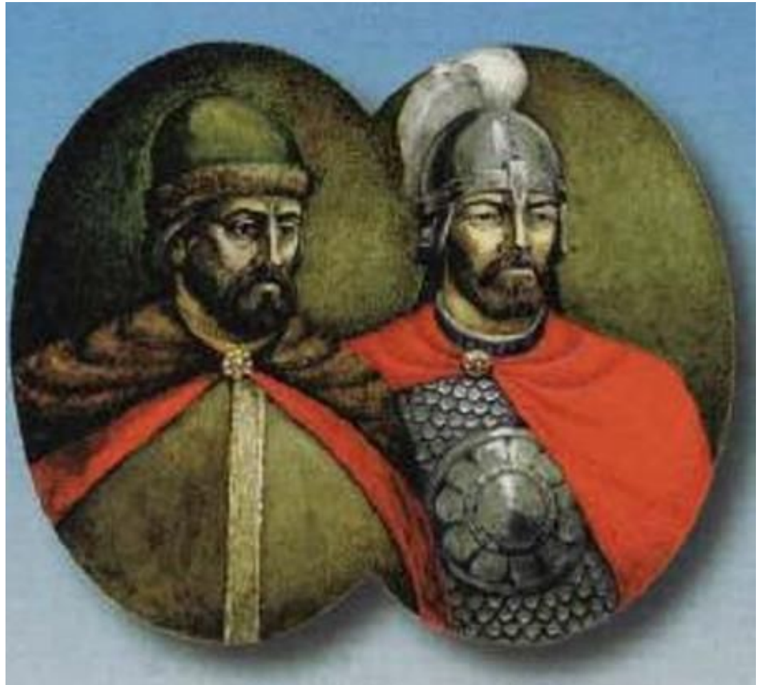
Аскольд и Дир

В 862 г. начало правление в Киеве князей Аскольда и Дира