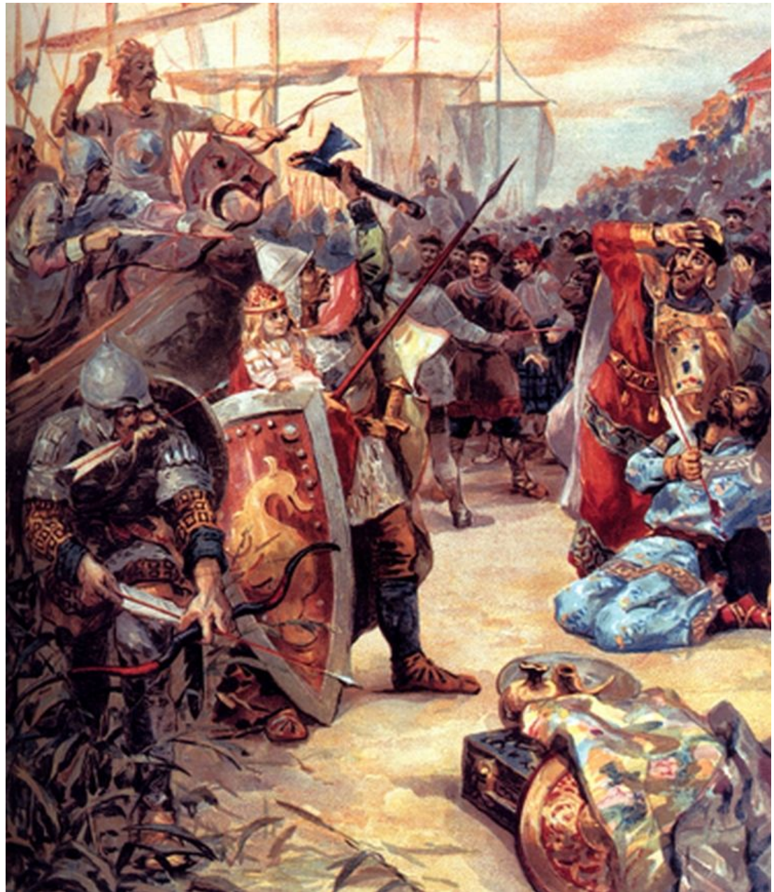
Убийство Аскольда и Дира. Неизвестный художник.

882 г. – образование Древнерусского государства.