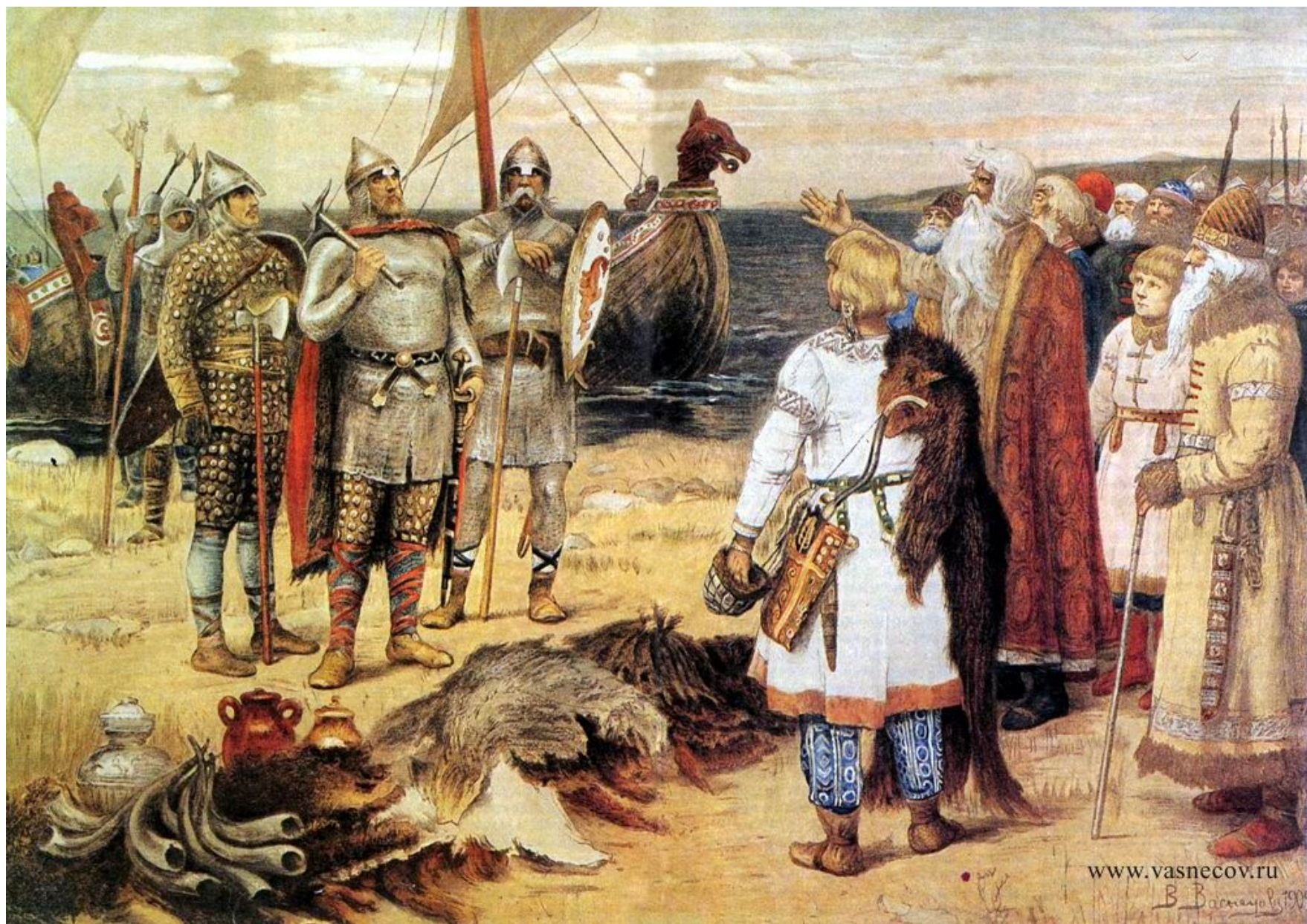
В.М. Васнецов. Призвание варягов. 1884 г.