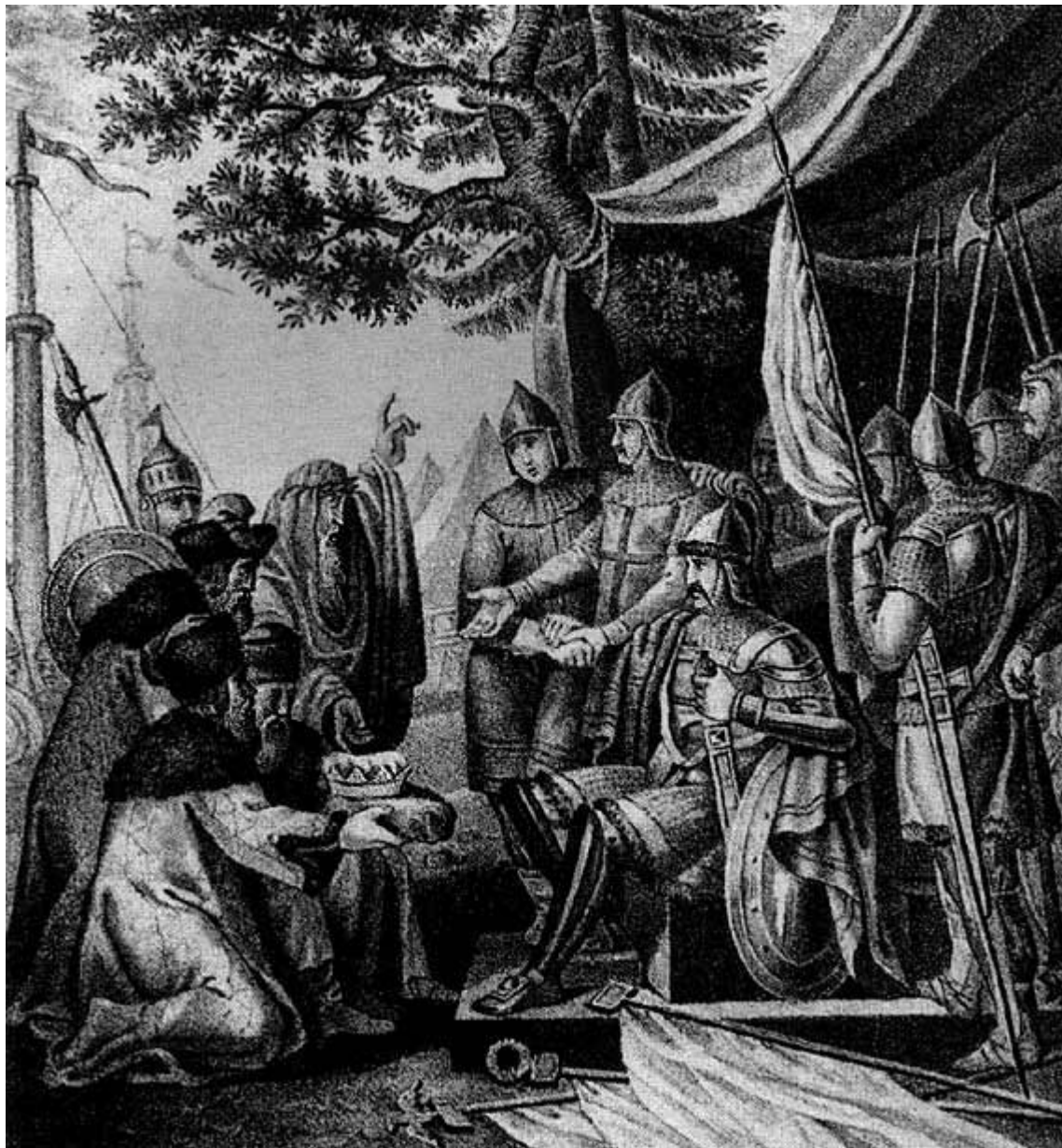
Рюрик, Трувор и Синеус