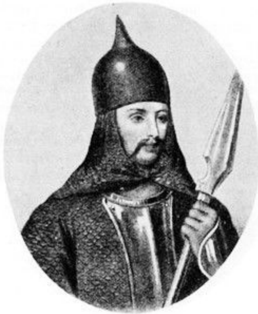
Новгородский князь Олег