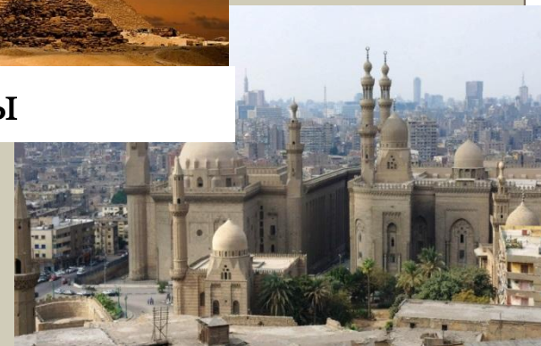
Памятники Средневековья — Исламский и Старый Каир