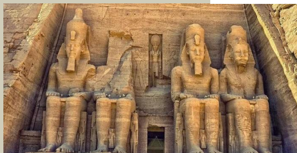
Храмы фараонов в Луксоре