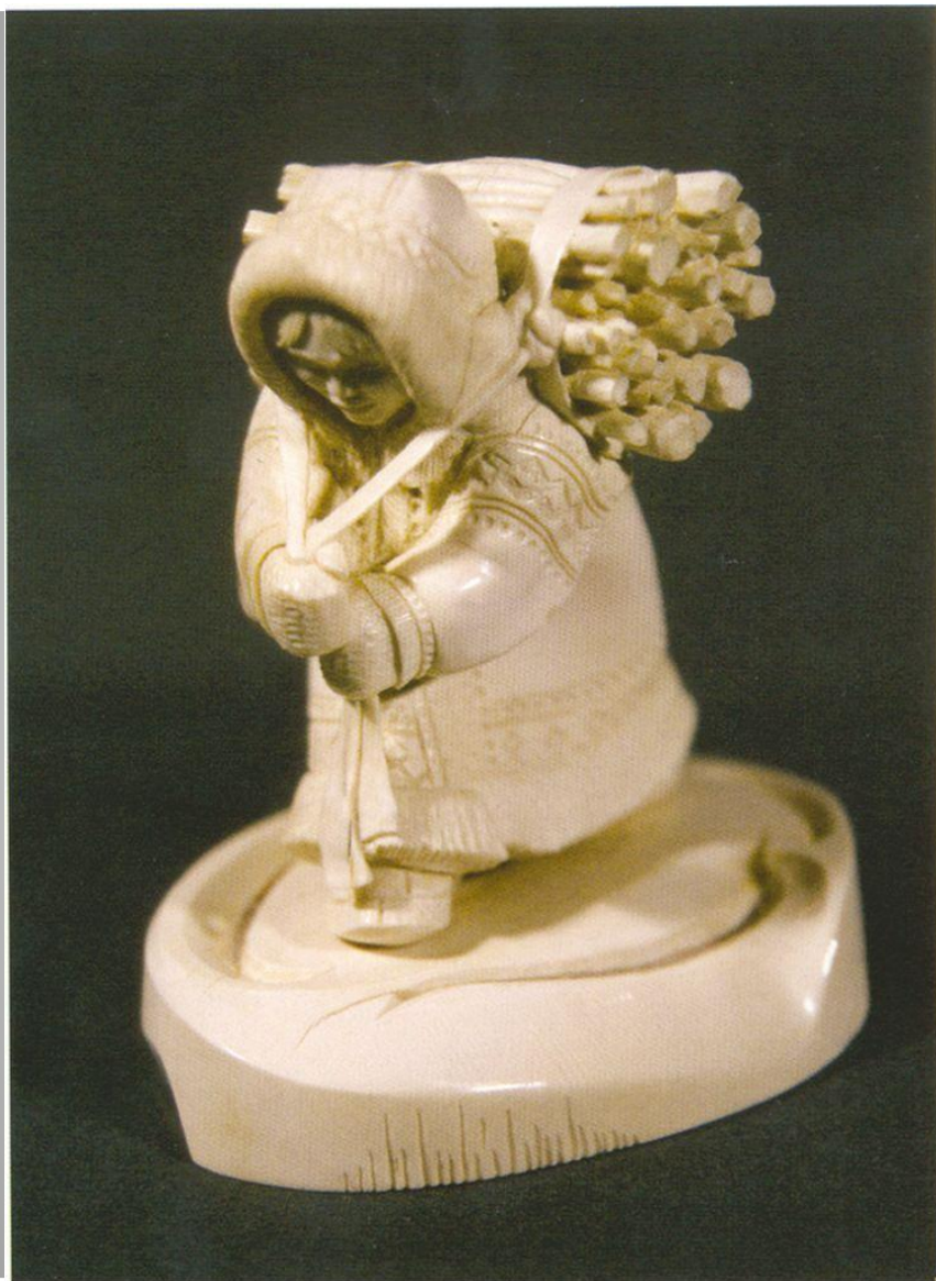
Е. Аляба «Из леса», бивень мамонта