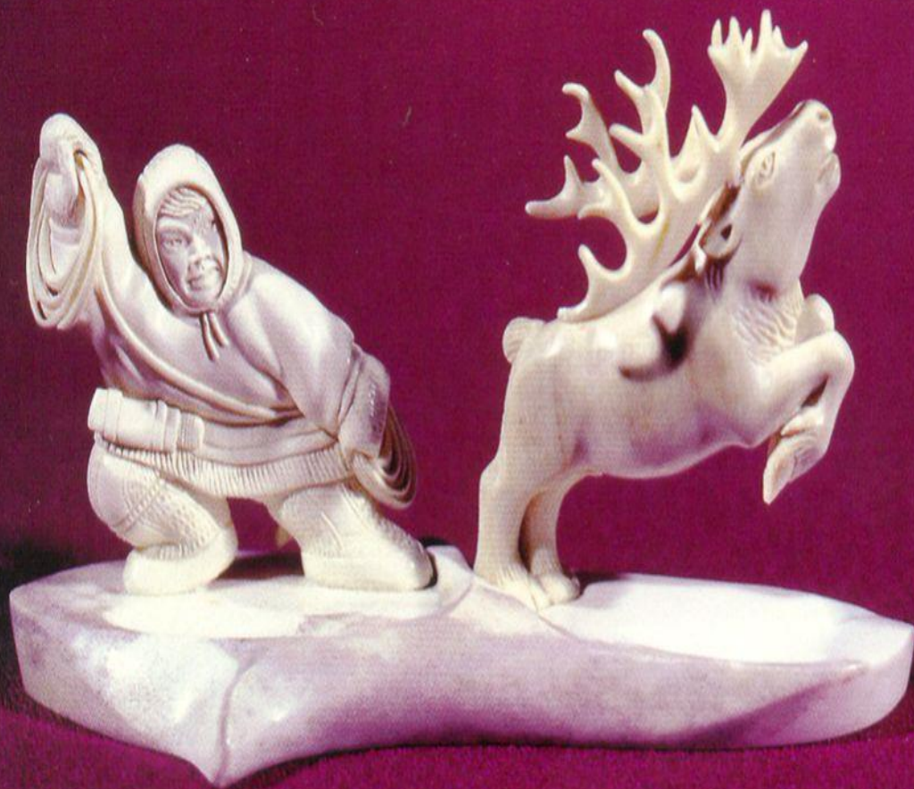
В. Ядне «Ловля оленья» Бивень мамонта, олений рог.