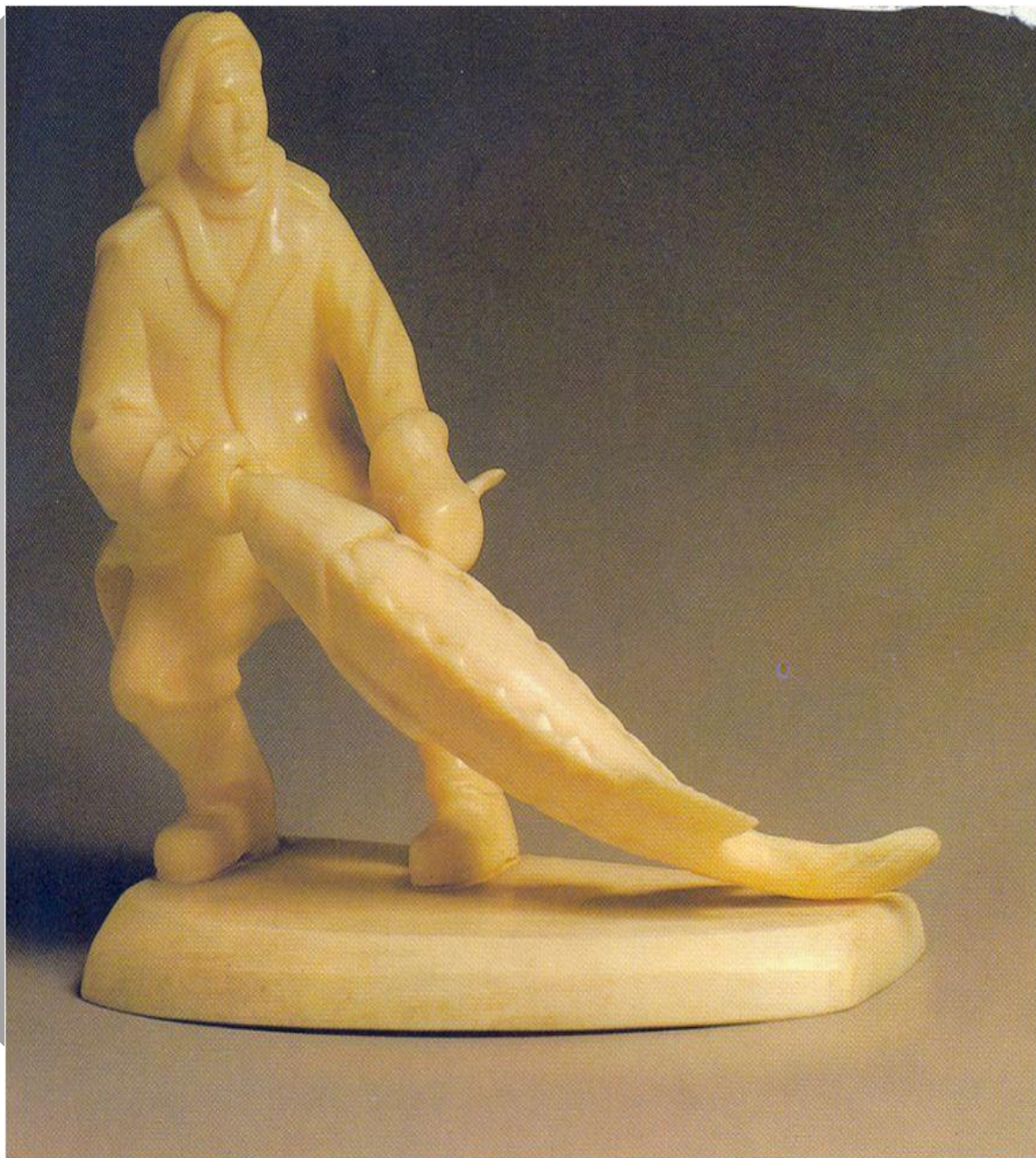
Д.М. Шушкано в «Рыбак с осетром» Зуб кашалота.