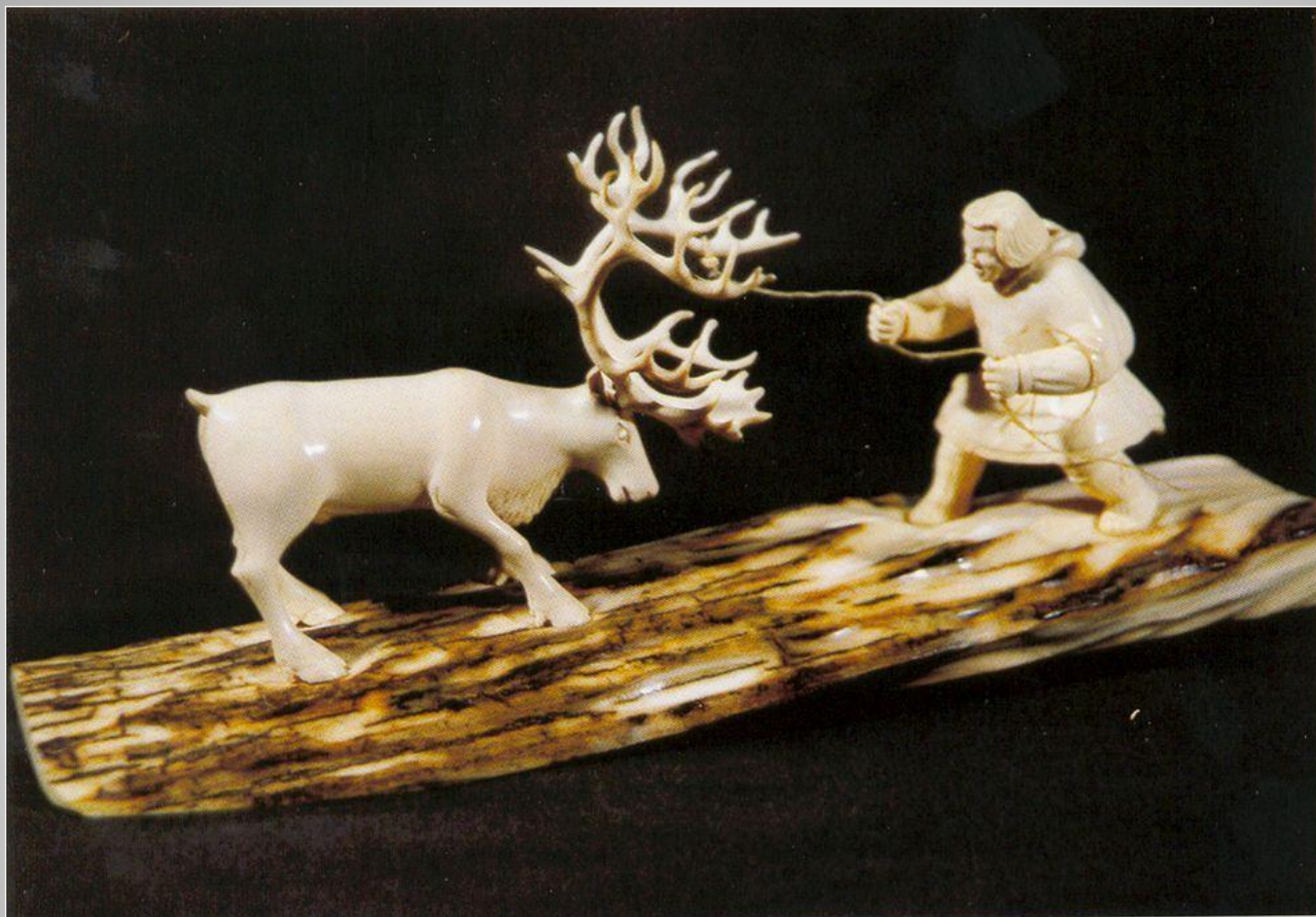
А. Куделин «Отлов» Бивень мамонта.