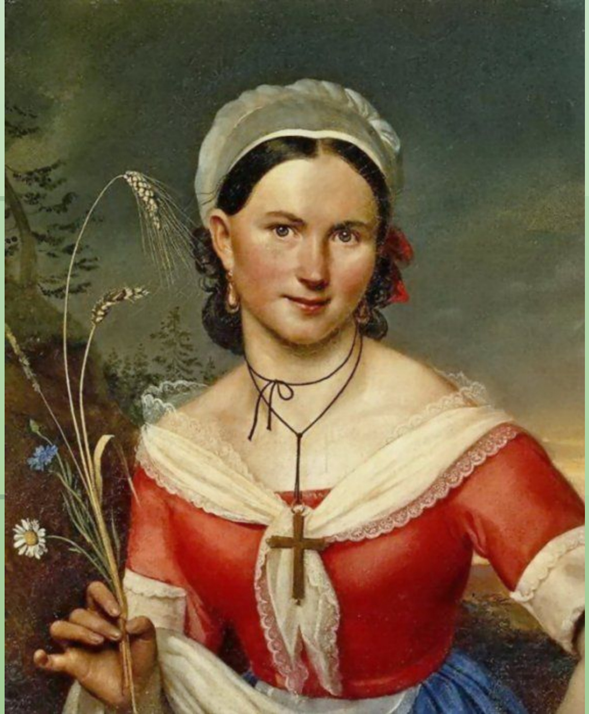
«Е. А.Телешова в роли Зелии» 1828г. ГТГ