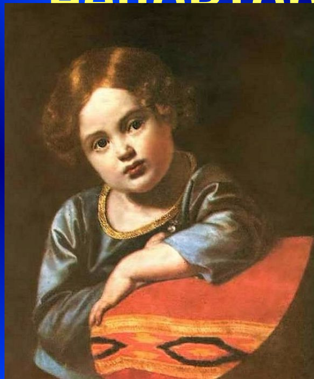
«Е. Г. Гагарина. в детстве»