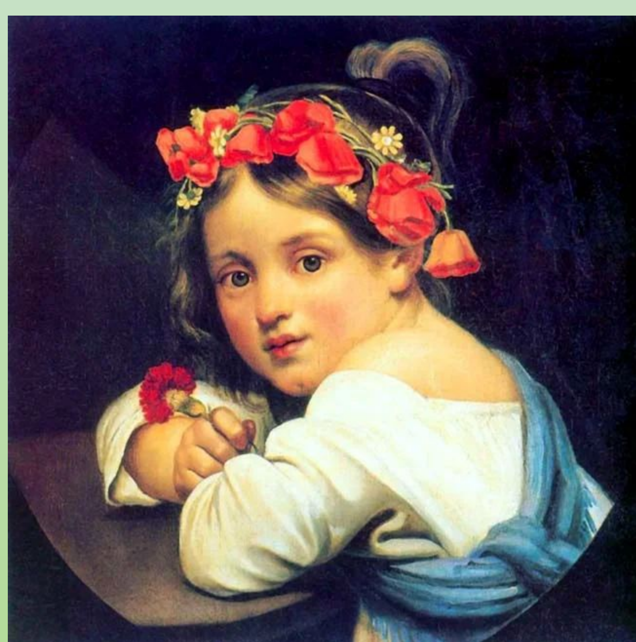
"Девочка с венком из мака." 1819