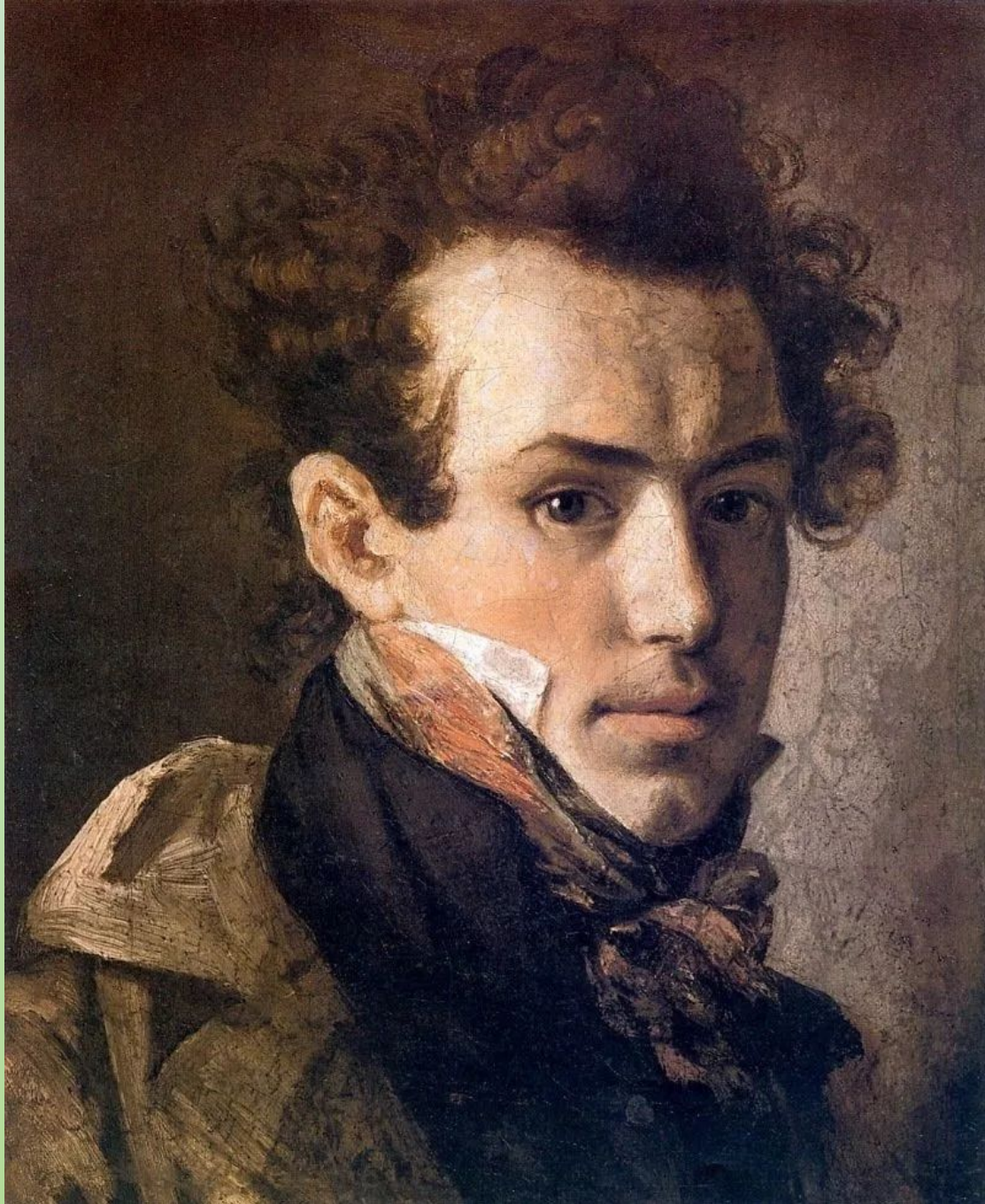
Автопортрет в розовом галстуке. 1809г.