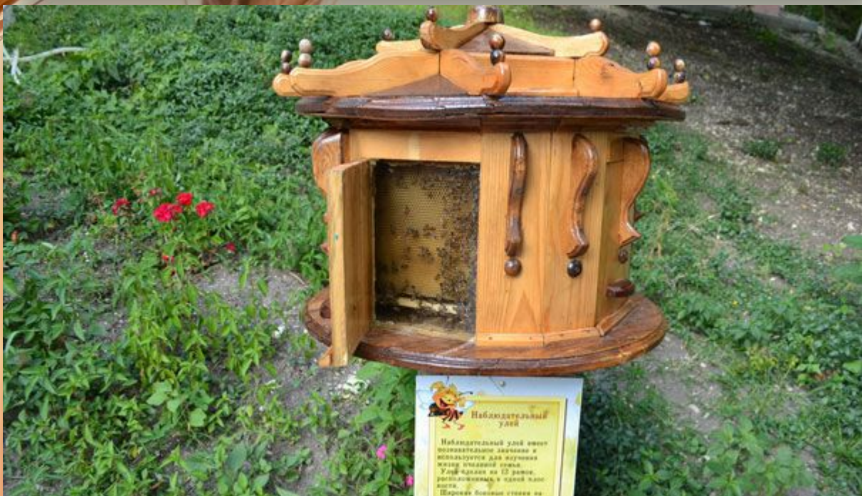
Наблюдательный улей Наблюдательный улей очень полезен для изучения и использования для научных целей пчелиной семьи. Улей-обсерватор на 12 рамок, расположенный в одной плоскости. Школа № 10, г. Москва