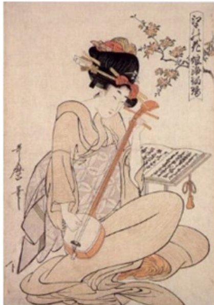
Цветы в Эдо