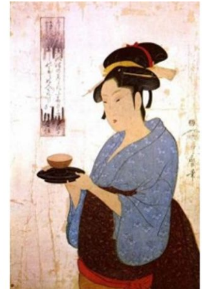
Девушка из чайного дома