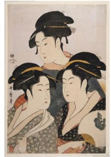
Три знаменитые красавицы

Китагава Утамаро (1753—1806) — японский художник, один из крупнейших мастеров укиё-э, во многом определивший черты японской классической гравюры периода ее расцвета в конце XVIII в.