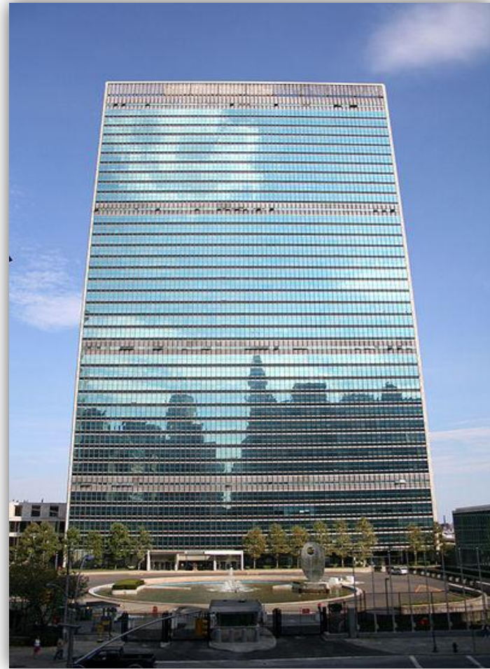
Штаб-квартира ООН в Нью-Йорке

Это уникальное международное сообщество, имеющее целью способствовать поддержанию и укреплению мира, экономическому и социальному прогрессу всех стран и народов.