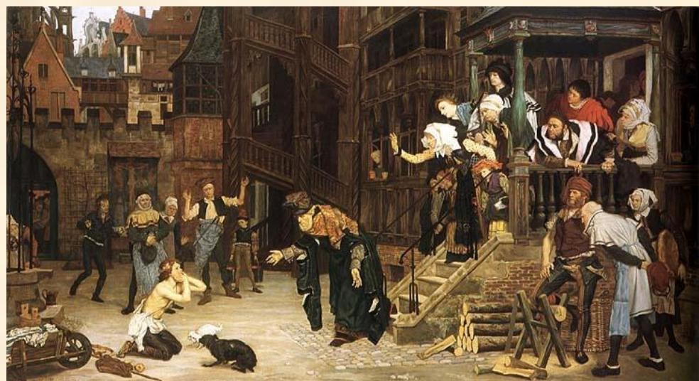
Джеймс Жак Джозеф