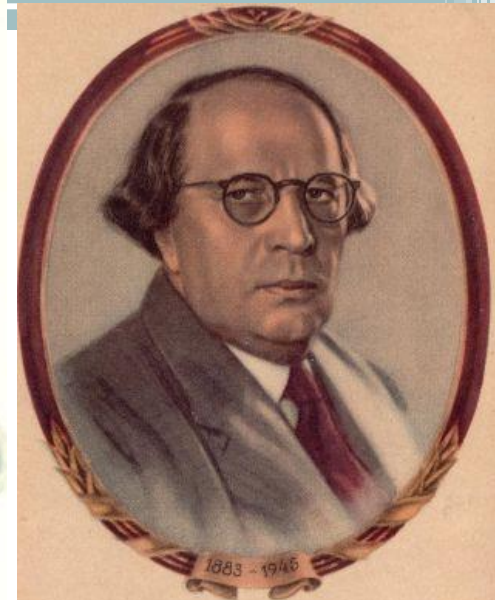
Алексей Николаевич Толстой