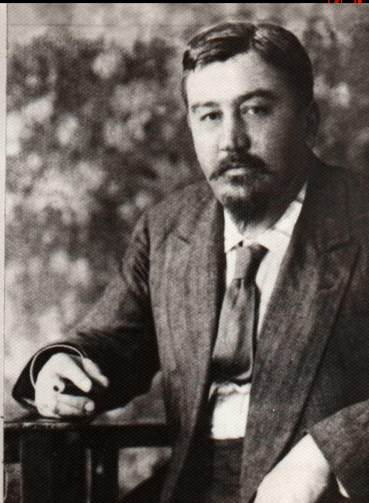
М.Куприна с дочерью Лидией. А.Куприн.1910 г.г.