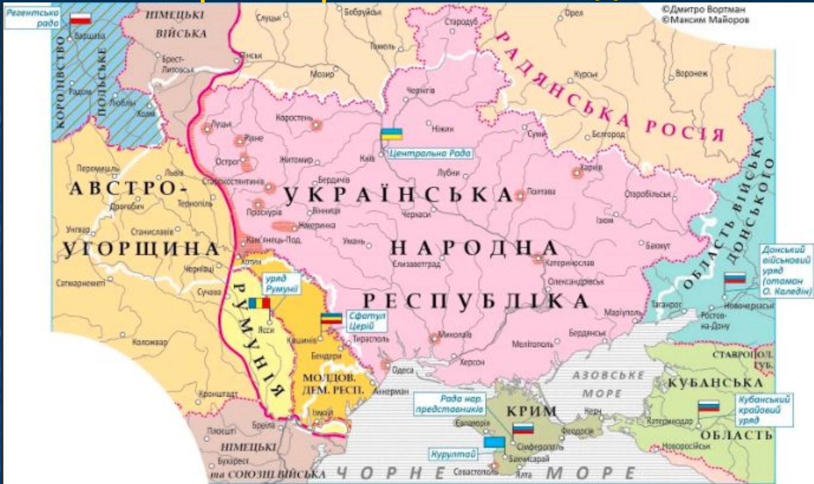
УКРАЇНА. ВОЄННО-ПОЛІТИЧНА СИТУАЦІЯ у середині грудня 1917 р.