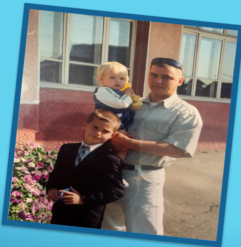
Наша семья: папа, мама, брат, сестра