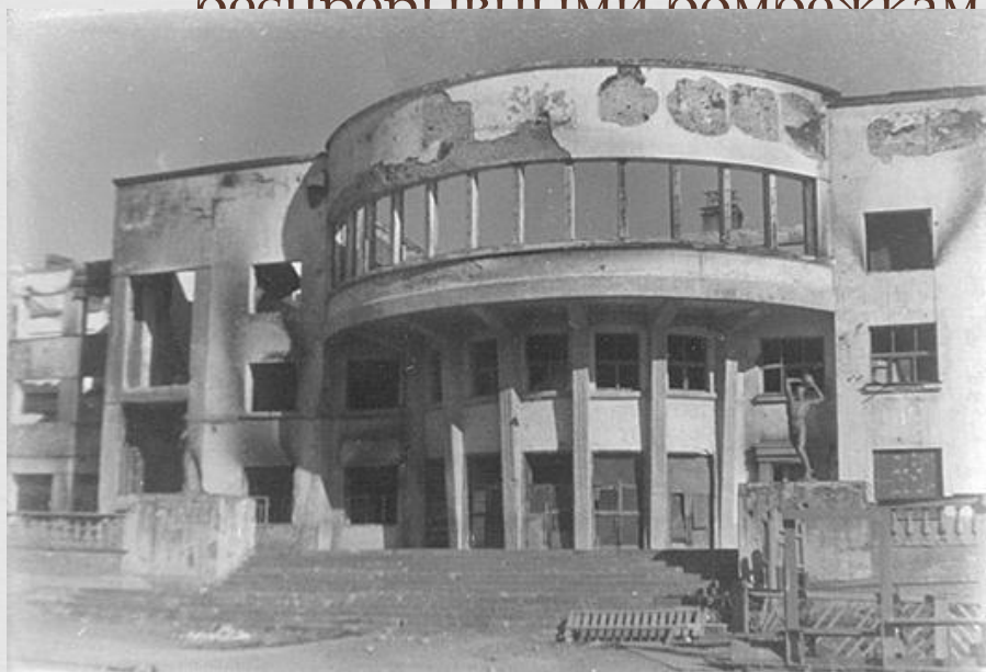
Дом Культуры после прямого попадания фугасной бомбы

□ Подлинный героизм проявили мурманчане, которые, не щадя себя, трудились для фронта, для победы в море, на причалах, у станков. Не смогли фашисты с ходу захватить и порт, через который проходили необходимые для фронта грузы, они пытались уничтожить их беспорядочными бомбежками. Намертво заблокировать с моря